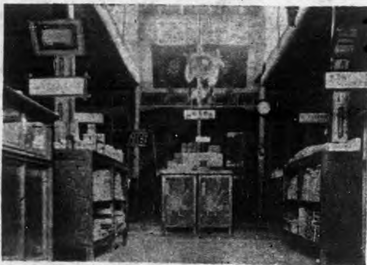
景內堂店館分安四