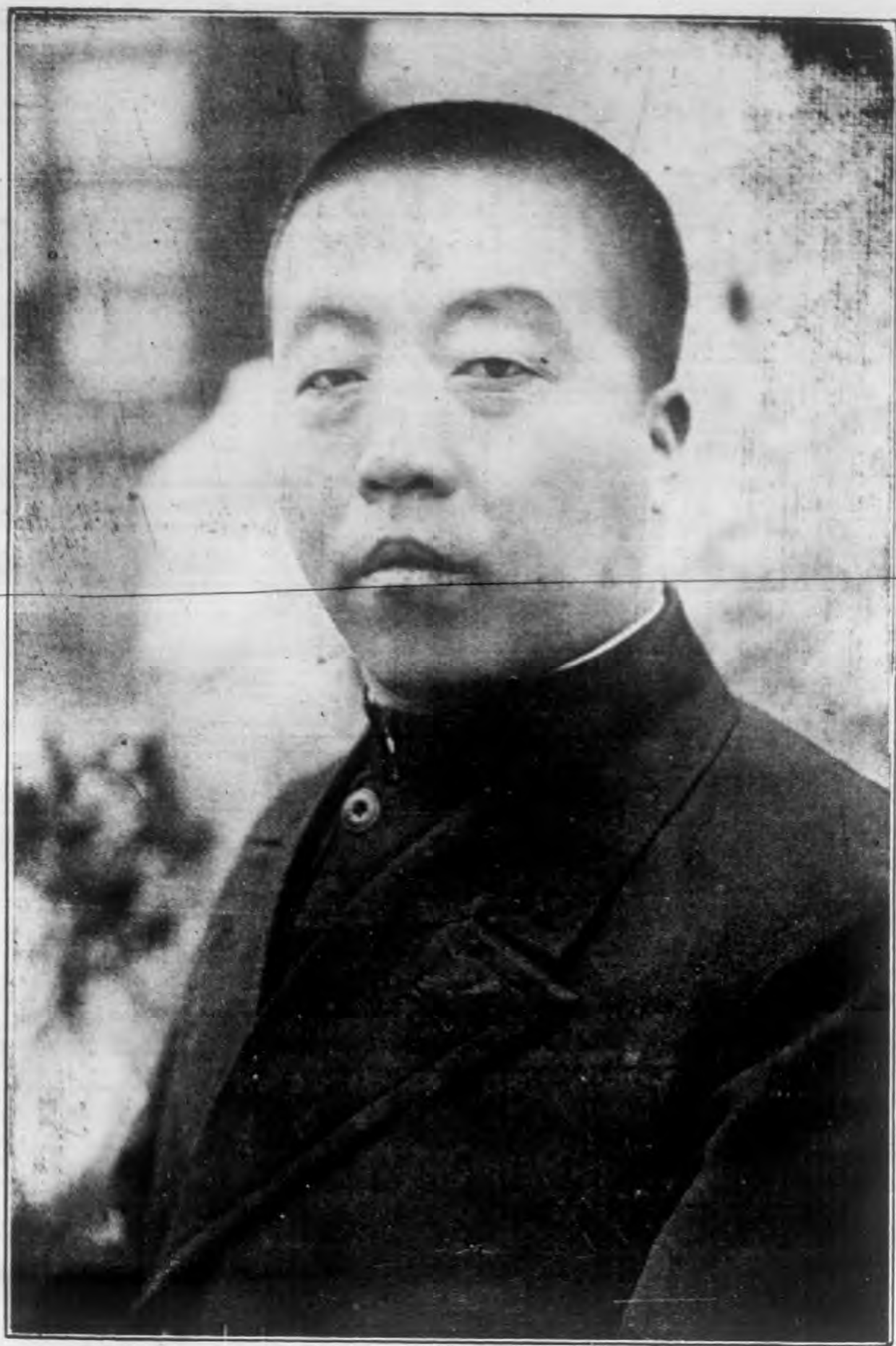
榮 向 王 長 廳