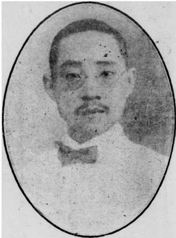
朱 執 信 像