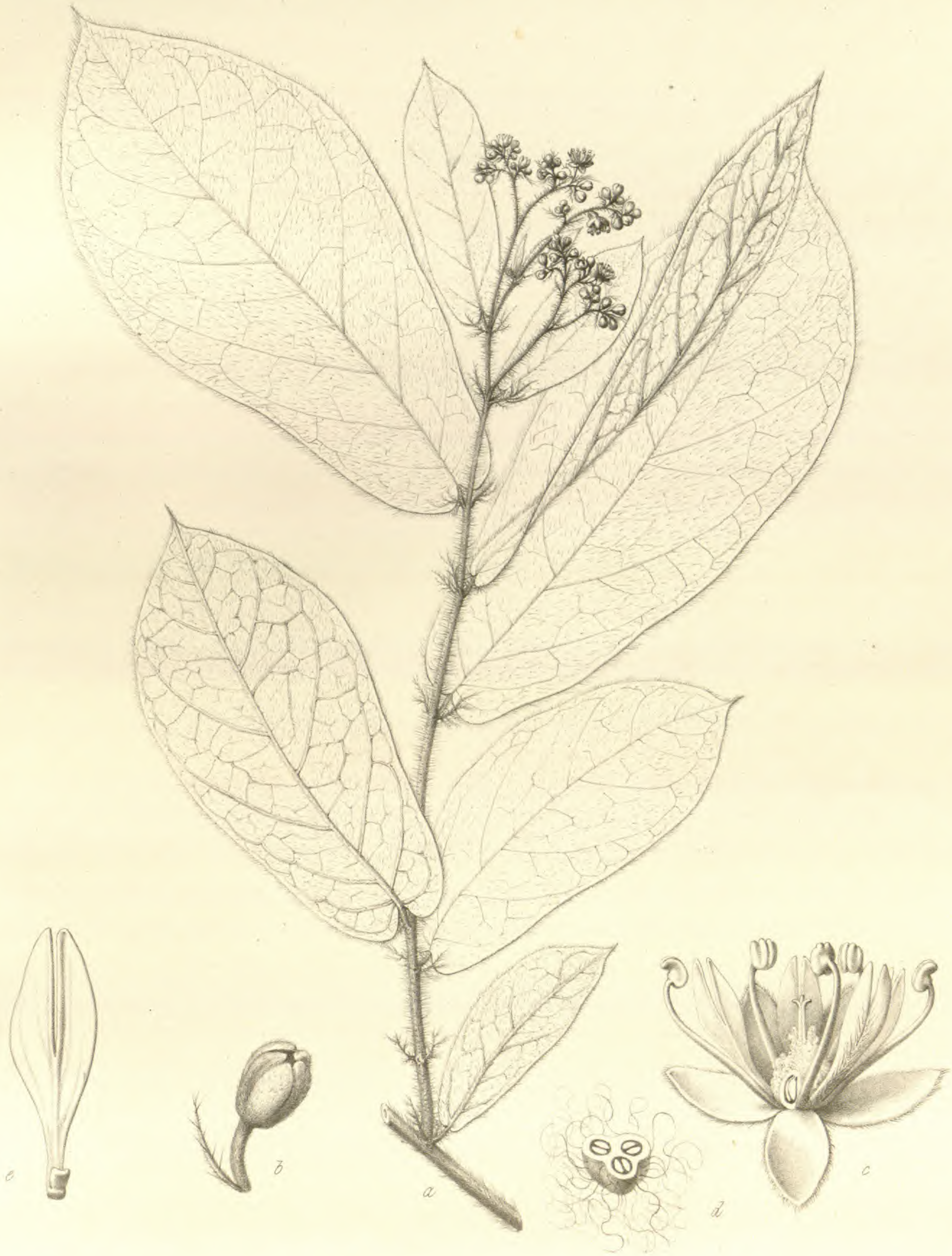
Chaillatia mossambicensis Klotzsch.