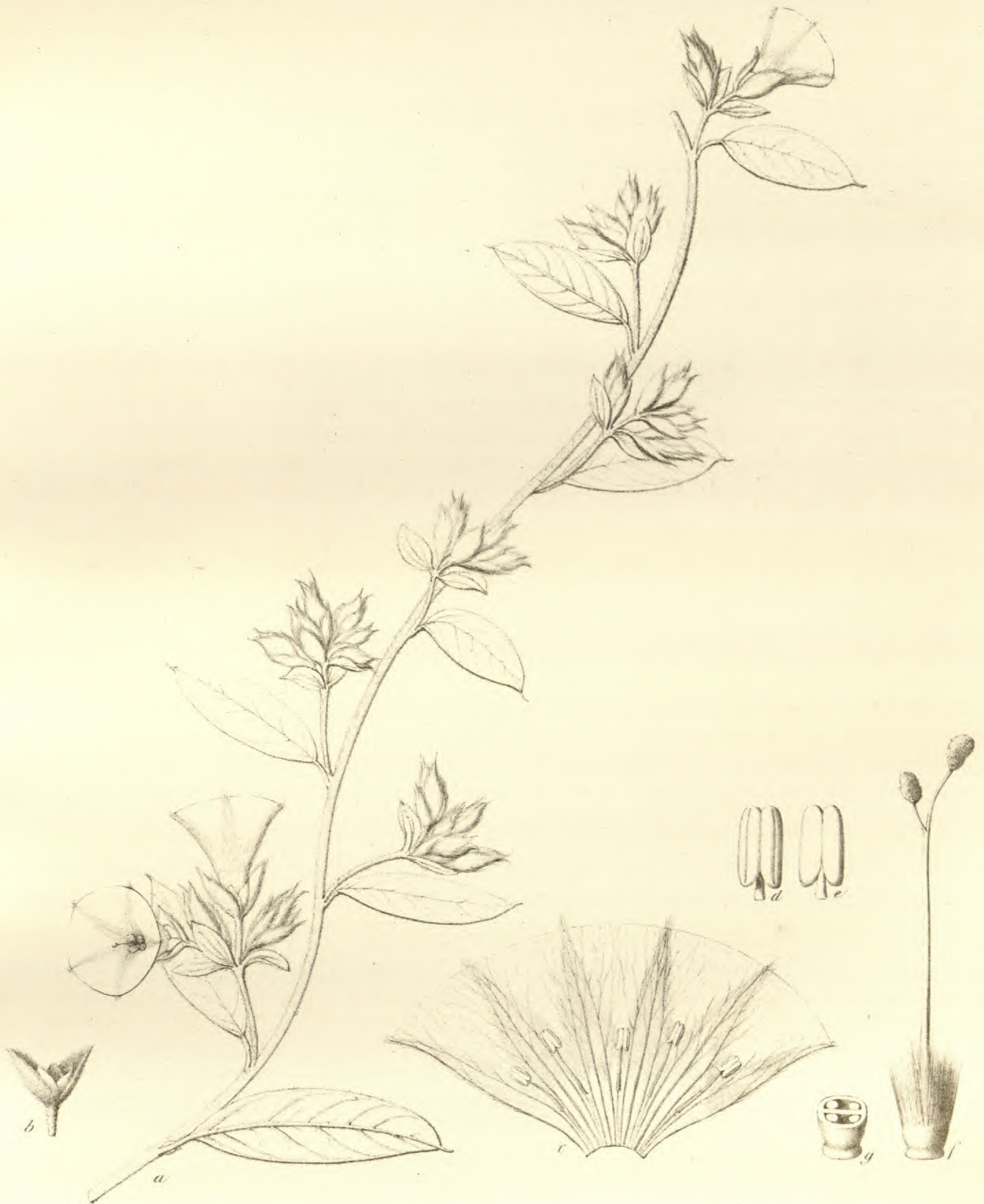
Prevostea Mossambicensis . Klotzsch