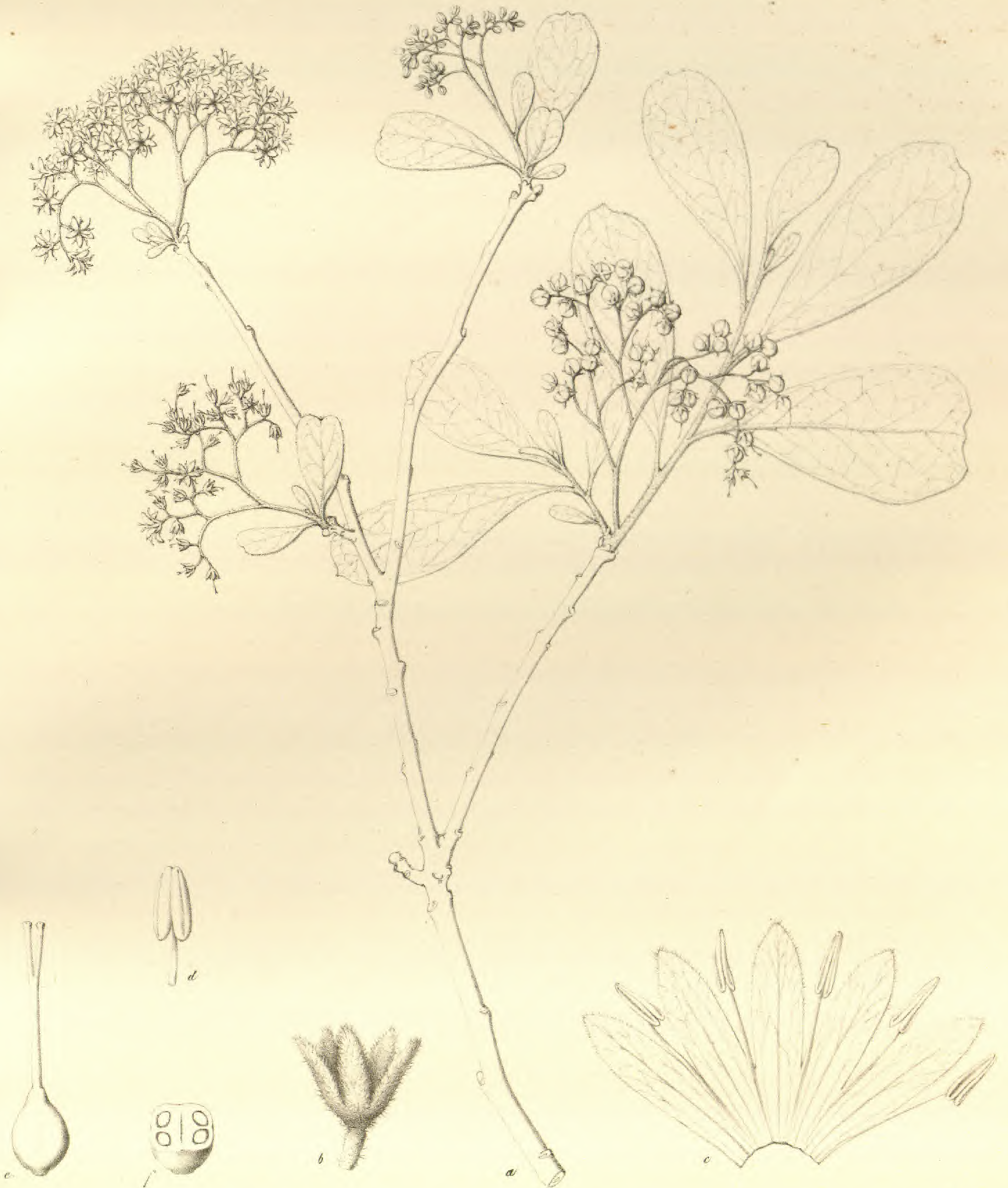
Ehretia amoena Klotzsch.