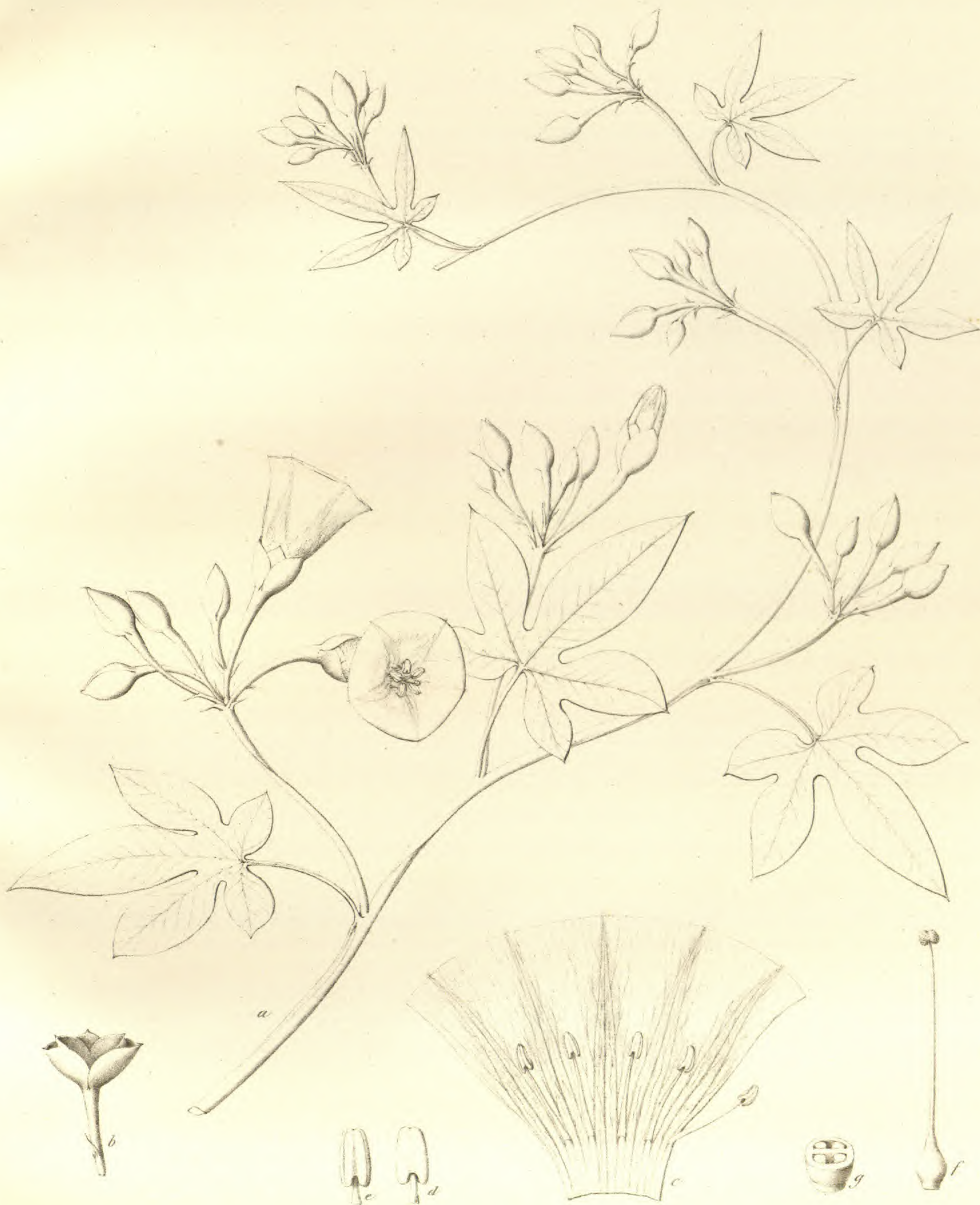
Ipomaea Petersiana Klotzsch