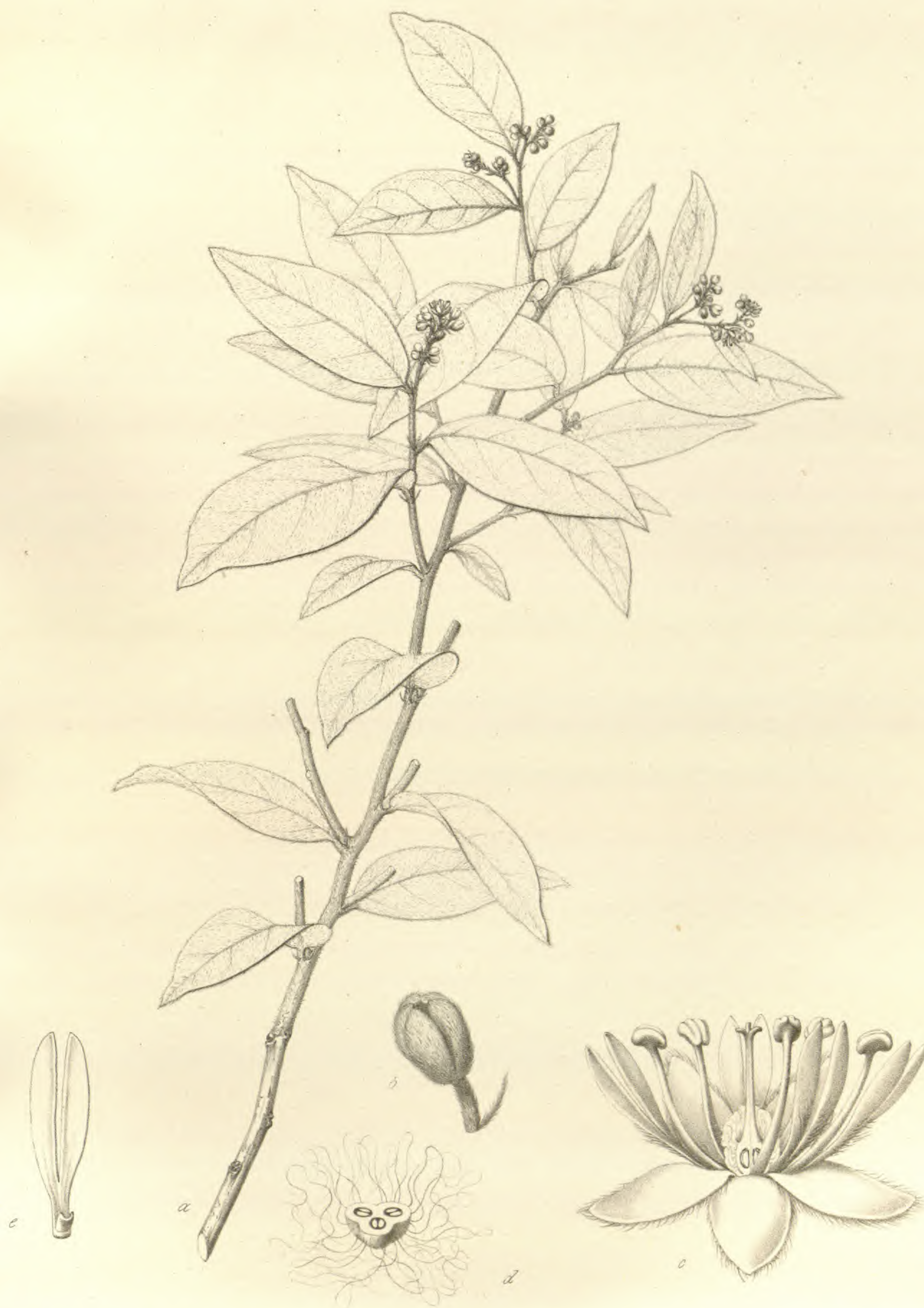
Chaillertia deflexa Klotzsch.