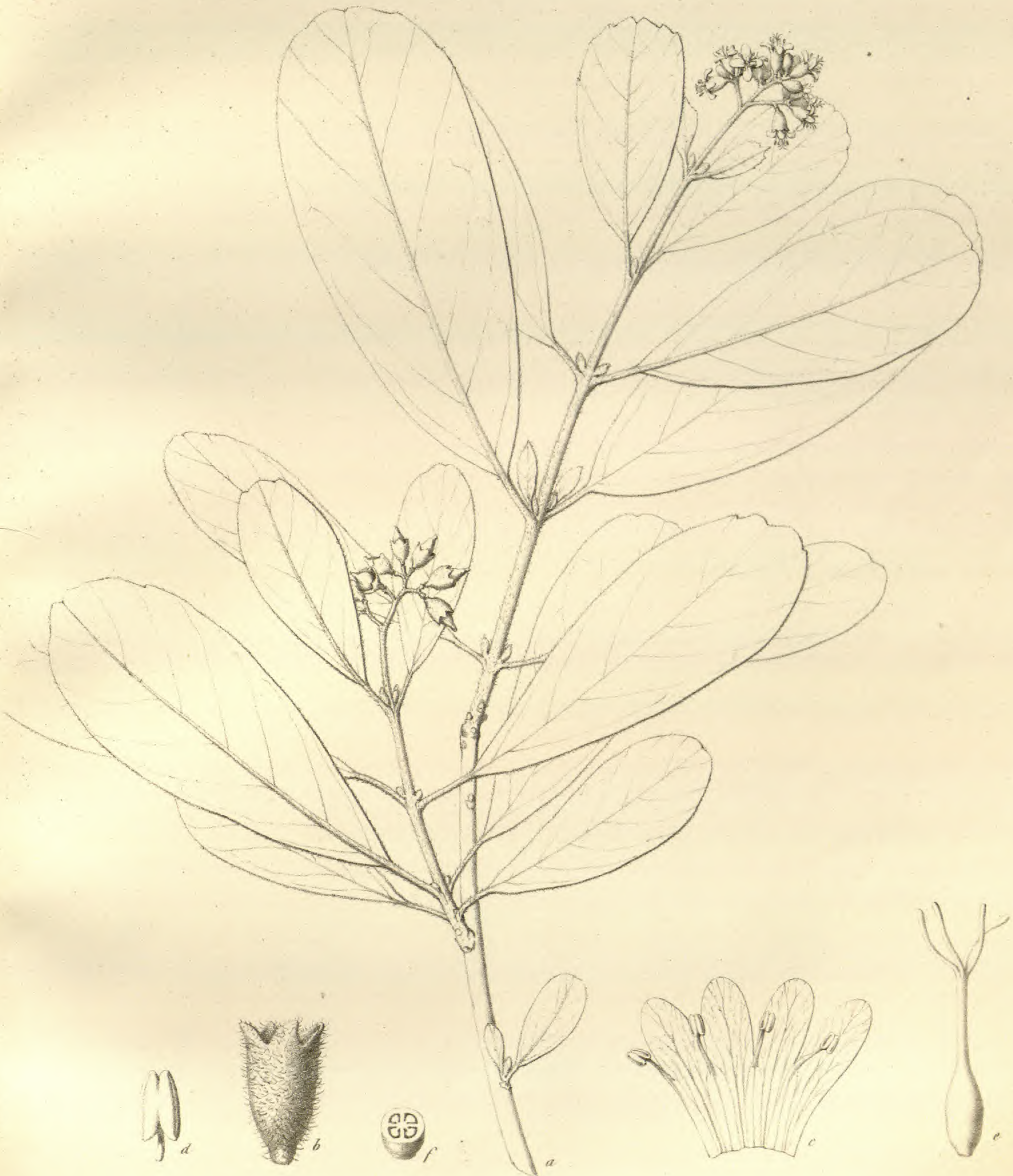
Cordia quercifolia Klotzsch.