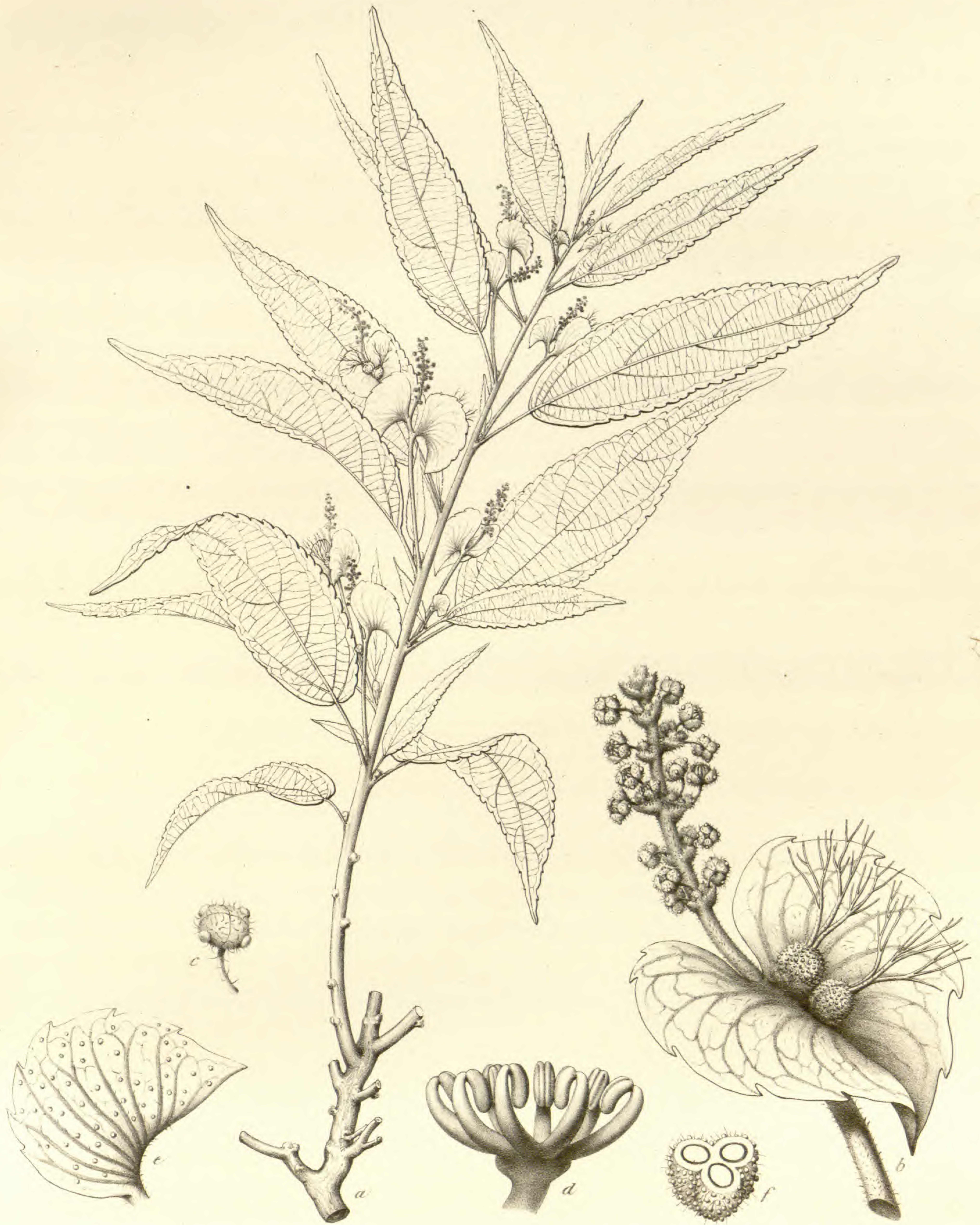
Calyptrospatha pubiflora Klotzsch.