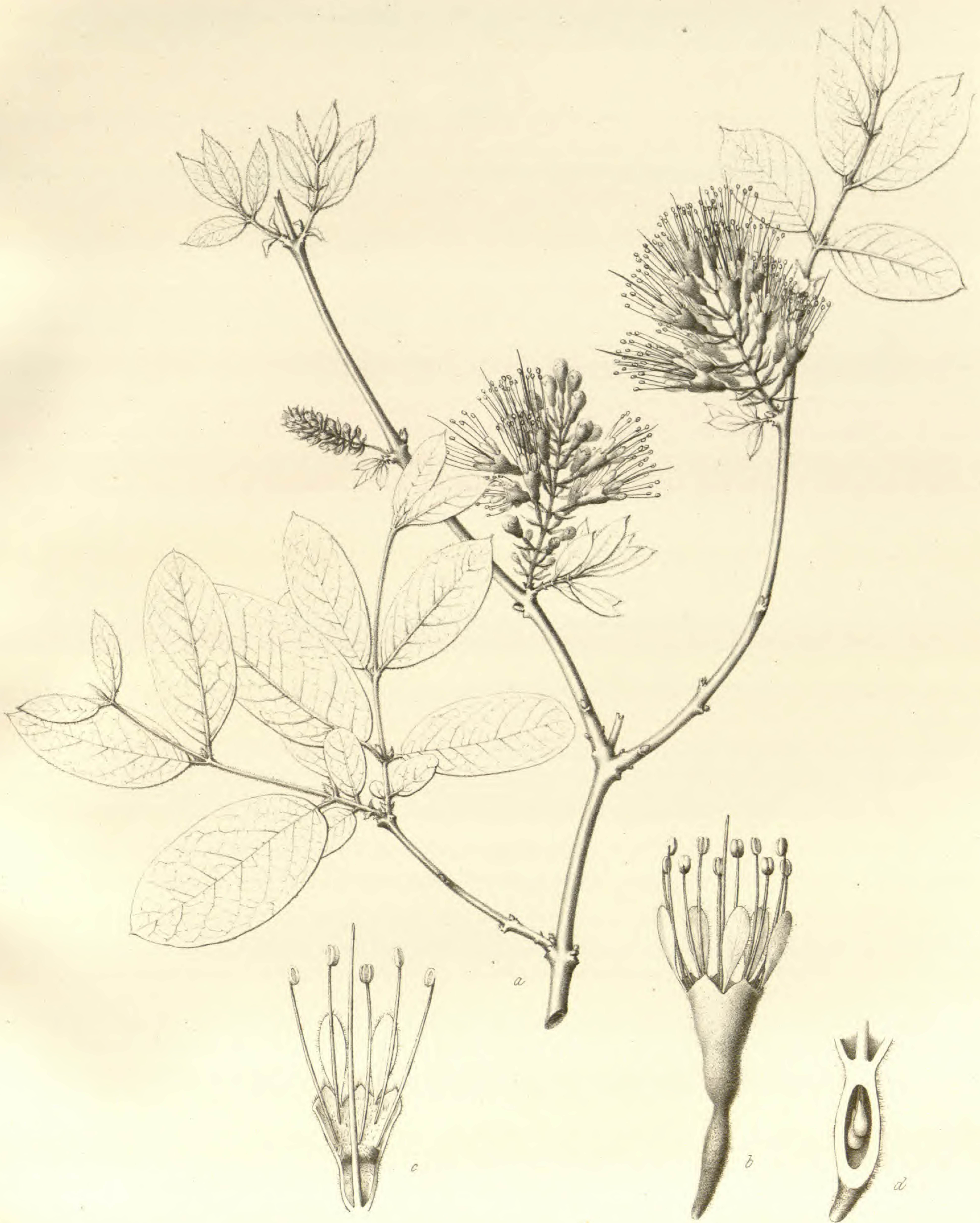
Poivera mossambicensis Klotzsch