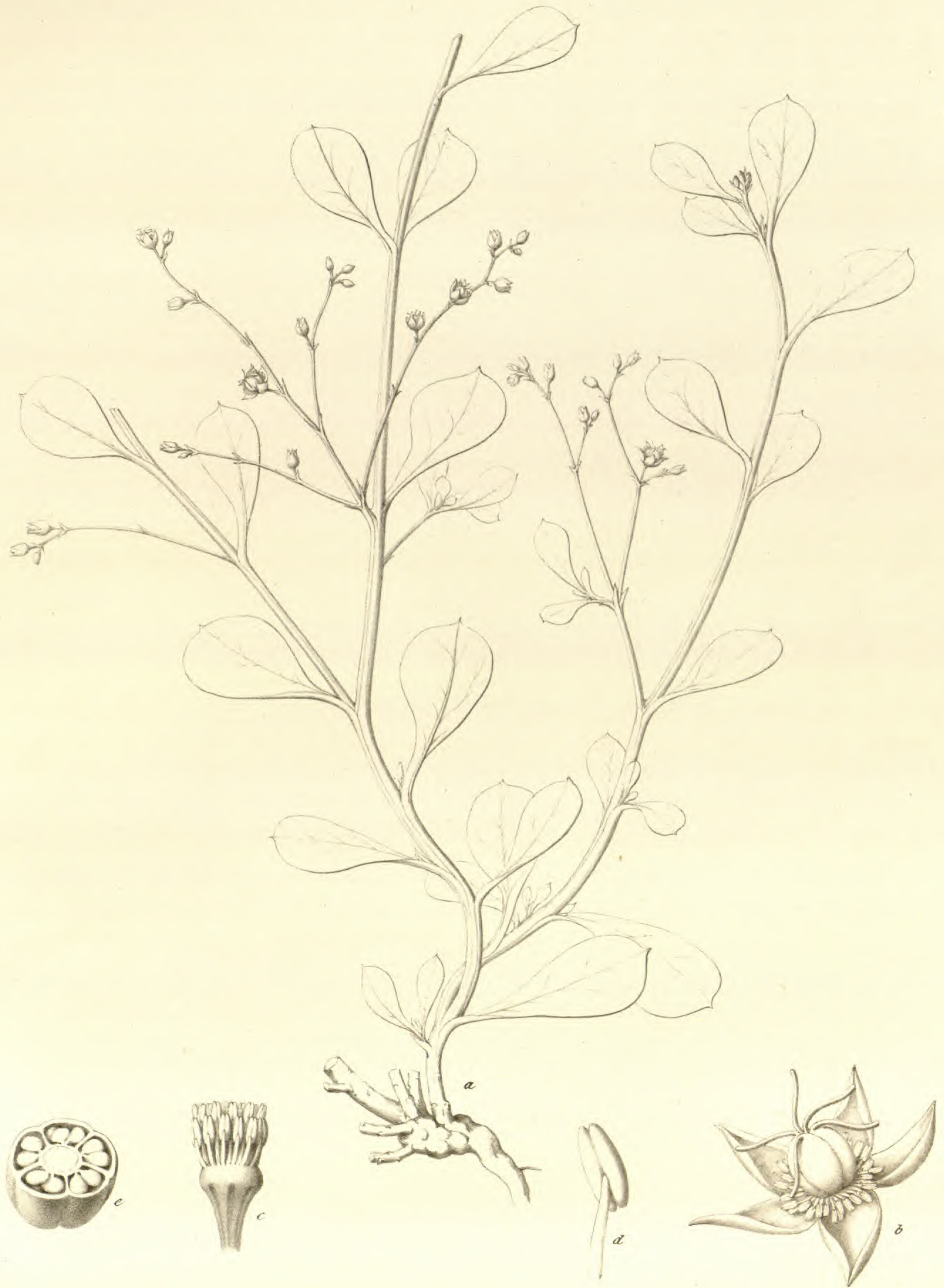
Glinus mucronatus . Klotzsch.