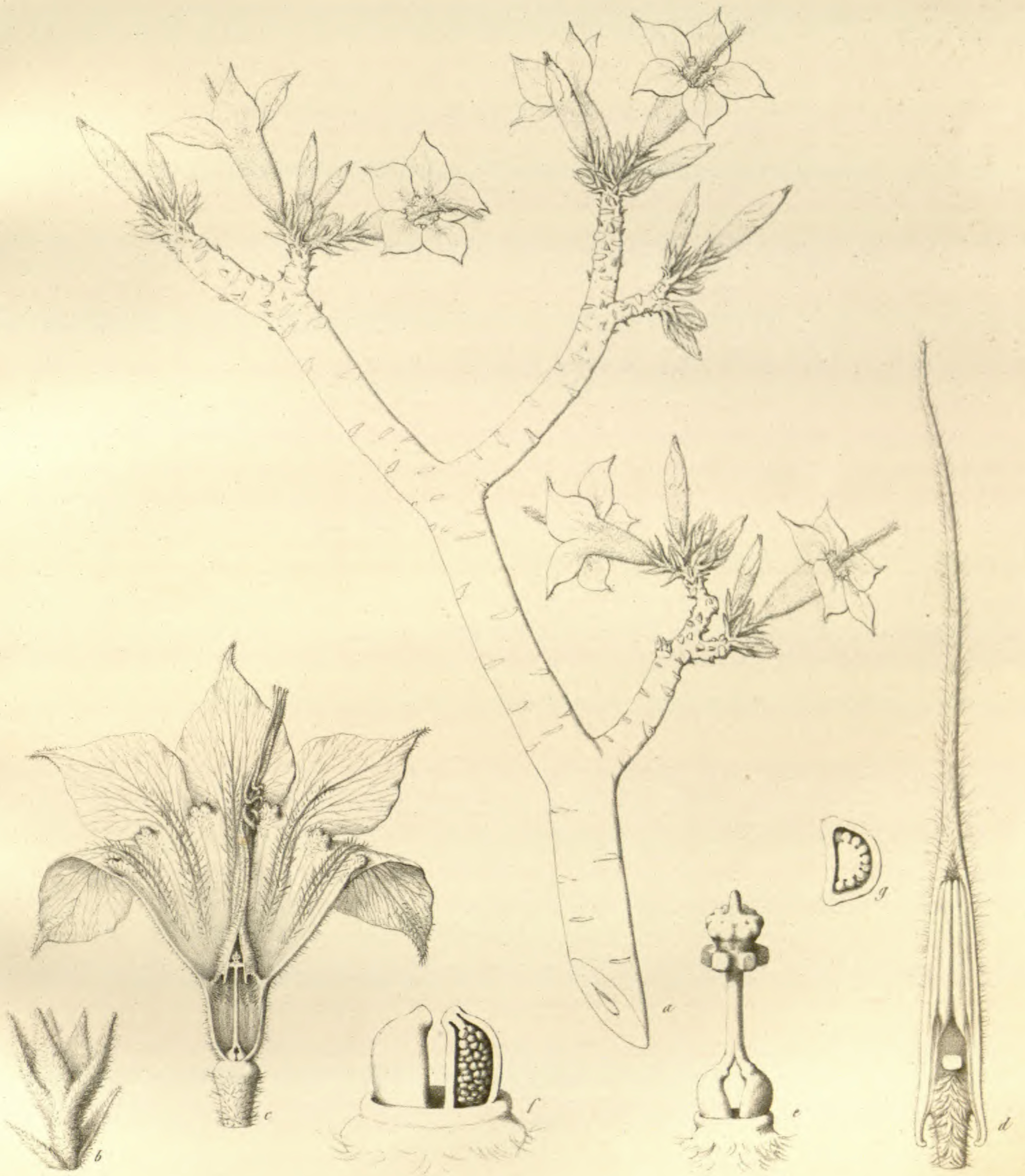
Adenium multiflorum Klotzsch.