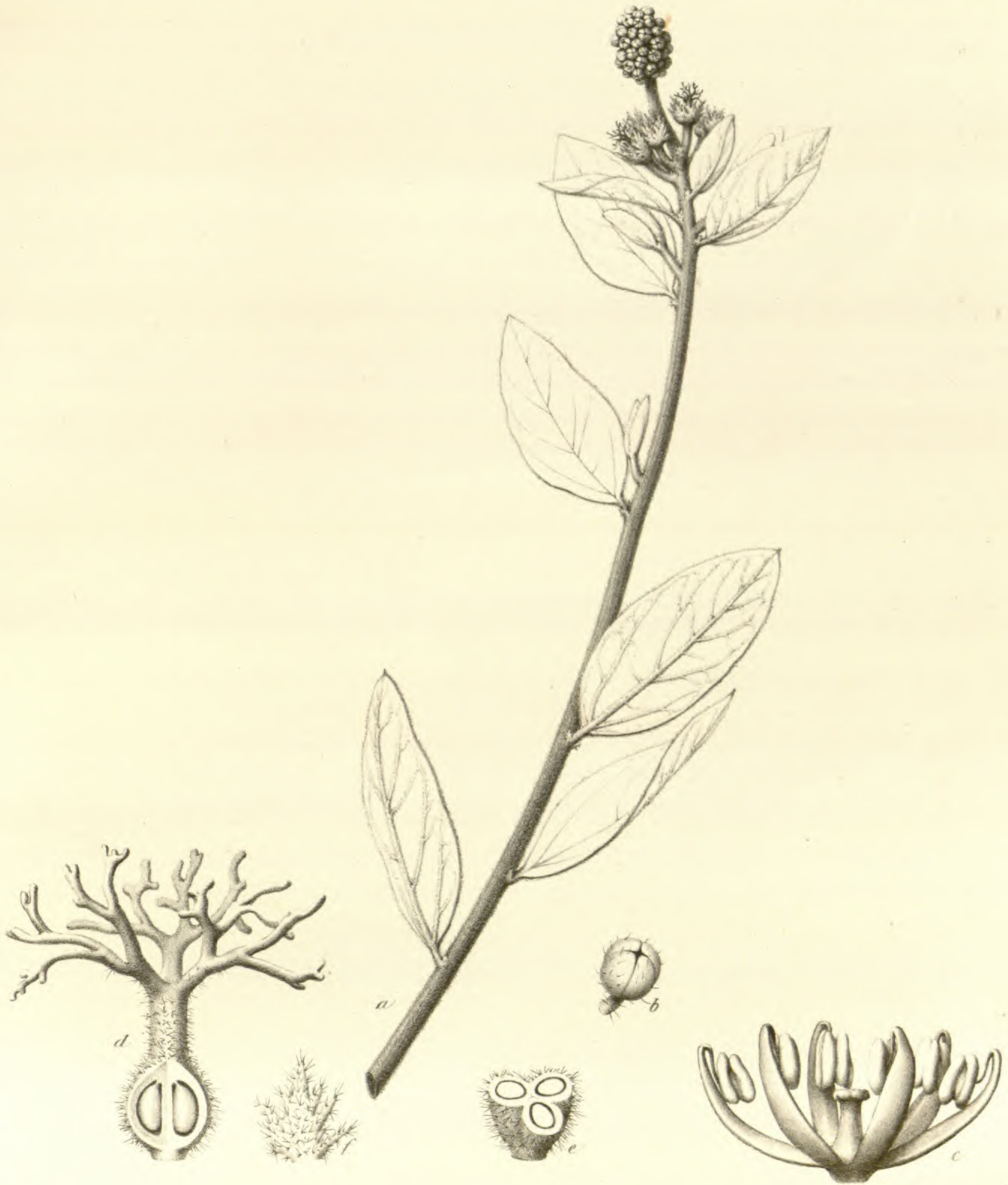
Cephalocroton mollis Klotzsch.