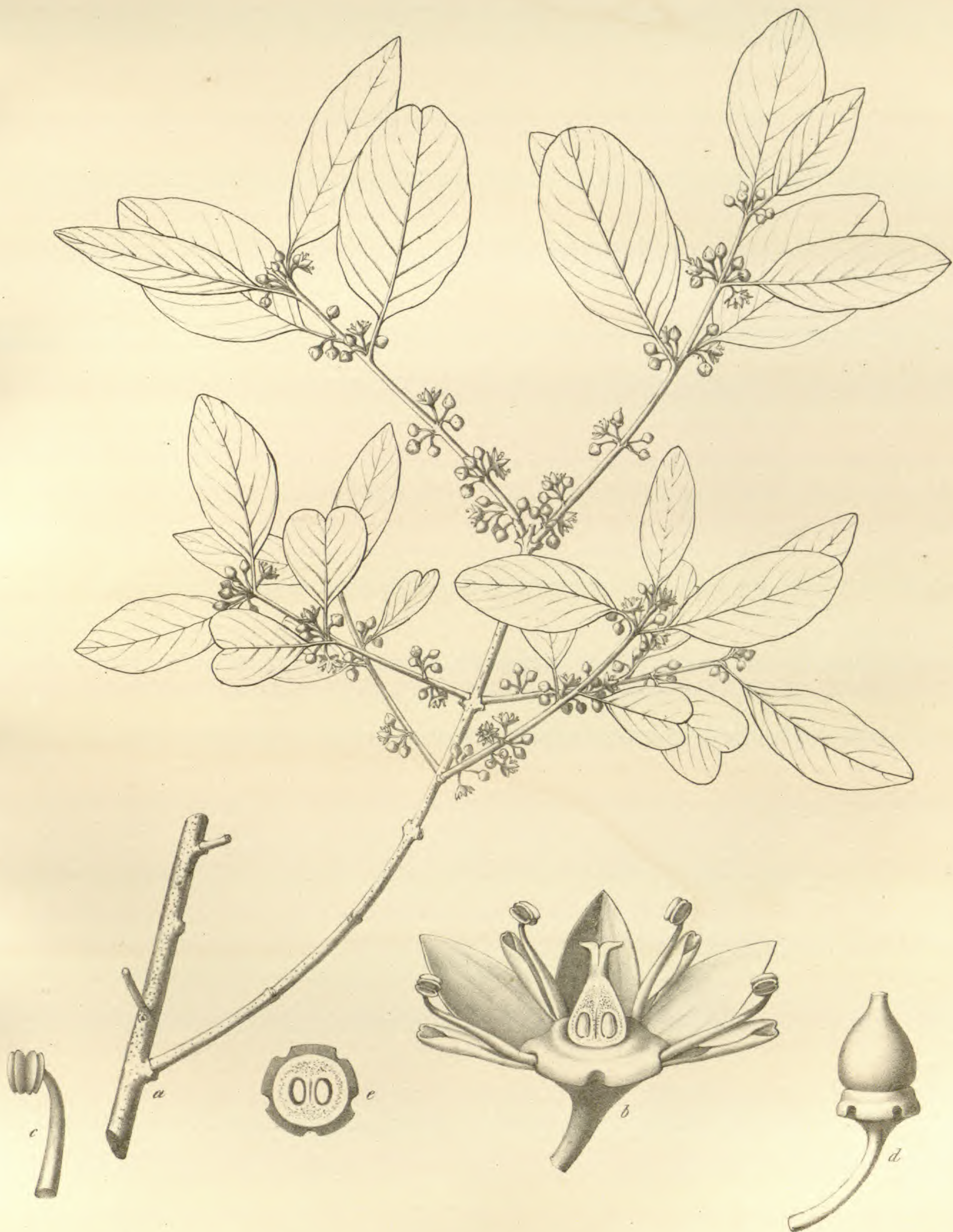
Scutia discolor . Klotzsch.