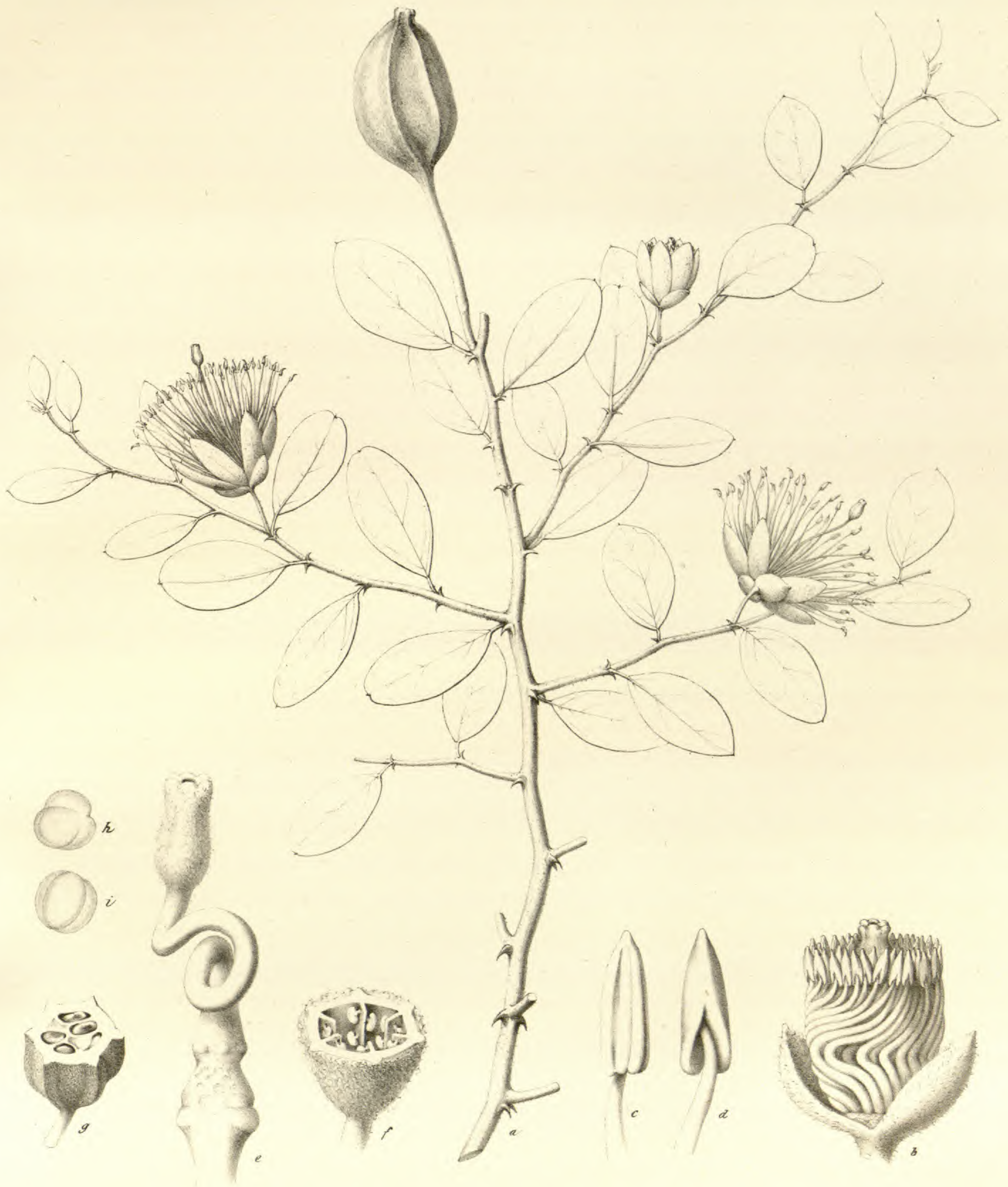
Petersia rosea . Klotzsch.