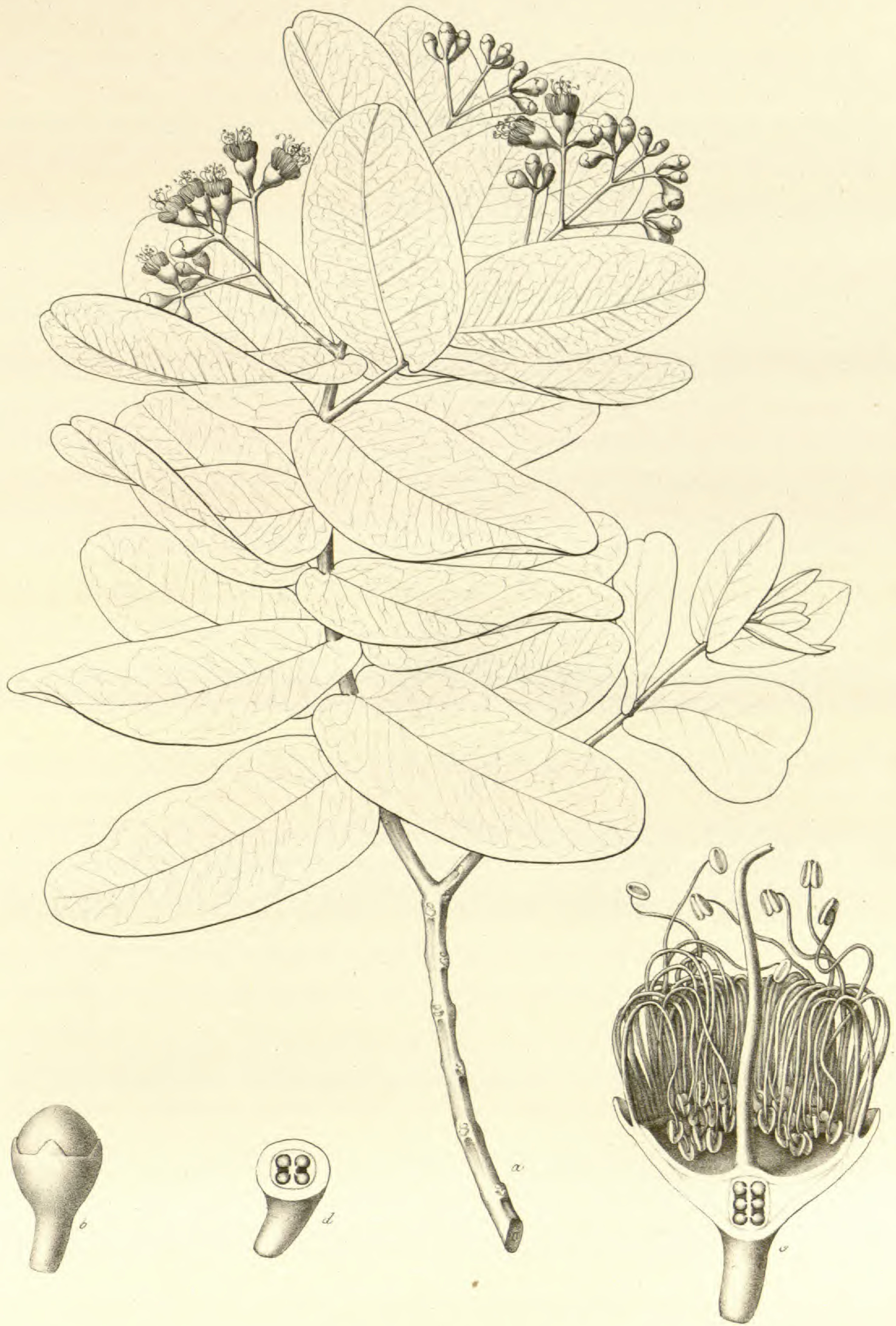
Syzygium cordifolium Klotzsch.