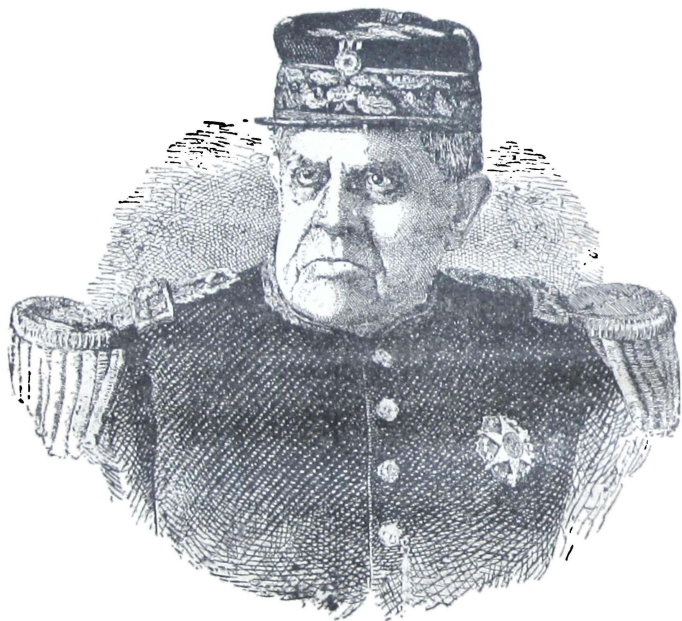
DOMINGO FAUSTINO SARMIENTO.