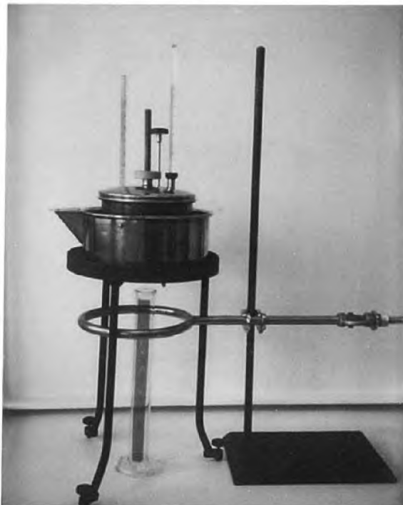
Рисунок 2 – Вискозиметр Энглера с мерным цилиндром вместимостью 50 см 3

Мерный цилиндр вместимостью 50 см 3 , калиброванный при 20 °С (рисунок 2).