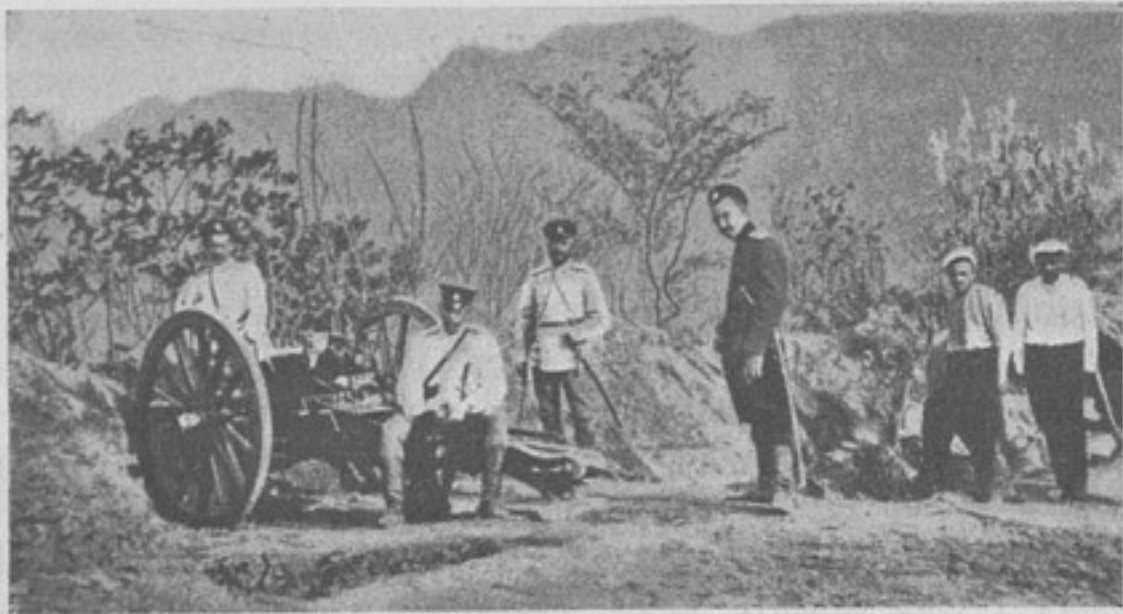
Маскированная артиллерійская позиція передъ фортами П.-Артура.

только на одну правую кнопку очень трудно, а на лѣвую... да кто ее, лѣвую-то застегиваетъ? А лежа, при срочной залповой стрѣльбѣ, еще того хуже; при подъемѣ же роты едва ли \frac{1}{3} людей успѣетъ застегнуть сумки, хотя бы на одну кнопку, а изъ остальныхъ, кто посноровистѣй—придер-