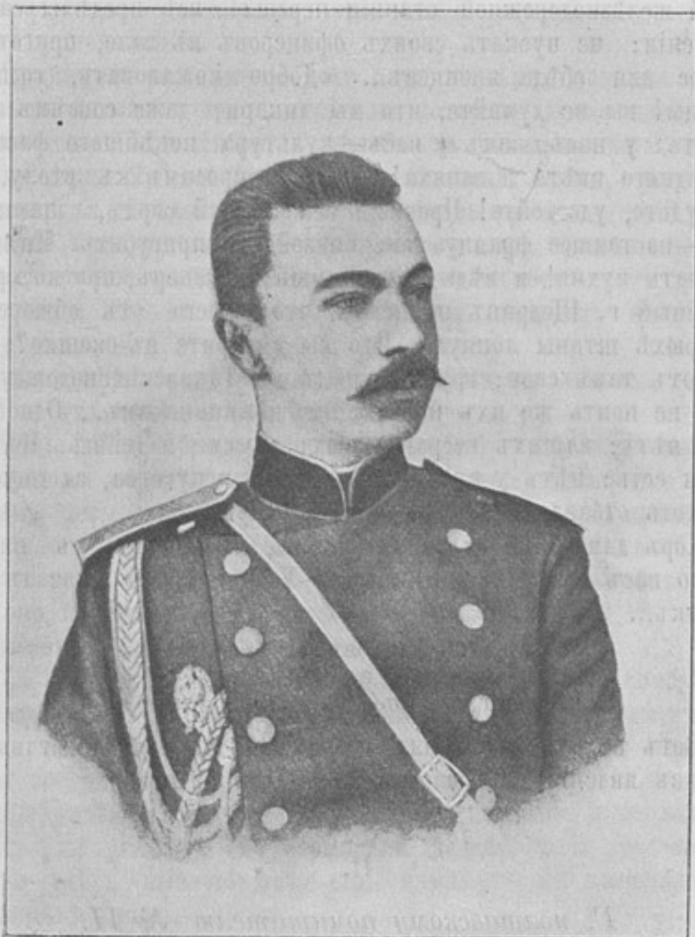
Командующій 9 Вост.-Сиб. стрѣлковой дивизіей, генераль-маіоръ Кипріанъ Антоновичъ КОНДРАТОВИЧЪ.

Война 1854—1855 гг. на Финскомъ побережьѣ. Историческій очеркъ. Съ 127-ю иллюстраціями. М. Бородкинъ. . . . . 4 р. Доблести Русскихъ воиновъ. Выпускъ I. При- мѣры изъ прошлой войны. Описание отдѣльныхъ солдатскихъ подвиговъ. 1877—1878 гг. Составилъ Л. М. Чичаговъ. Изданіе 7-е. . . . . 30 к. Одобрено Ученымъ комитетомъ Министерства Народнаго Просвѣщенія и циркуля- рами Главнаго Штаба 1887 г. № 228, 1888 г. № 234, 1889 г. № 277 и 1897 г. № 4.