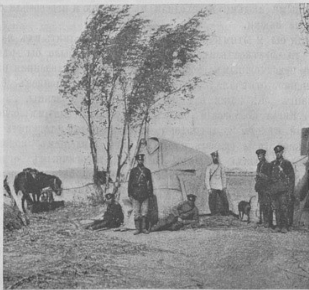
Постъ Пограничной стражи по р. Ляохъ у селенія Туй-Тавань. (Фотогр. шт. ротмистра Карпова, собств. корресп.).

17-го іюля, рано утромъ дивизія заняла позицію у Кангуалина, фронтомъ на востокъ. Всѣ съ большимъ напряженіемъ слѣдили за боевыми дѣйствіями передового отряда двухъ баталіоновъ Иркутскаго и Енисейскаго полковъ. Оба баталіона уже отошли къ сторожевому охраненію дивизіи, а двѣ роты даже очутились на нашей охотничьей горѣ праваго фланга. Означенные баталіоны были тѣсними превосходнымъ въ силахъ противникомъ, который повидимому готовился уже къ торжеству, для чего нѣсколько на флангѣ успѣлъ выкатить три батареи и открыть огонь по Енисейскому и Иркутскому баталіонамъ. Но противникъ ошибся: наши артиллеристы не даромъ просидѣли мѣсяць у Кангуалина, они всю впереди лежащую мѣстность распредѣлили на участки, выяснили вѣроятныя артиллерійскія позиціи наступающаго, опредѣливъ до нихъ разстояніе, цѣлый мѣсяць практикуясь въ занятіяхъ на позиціи.