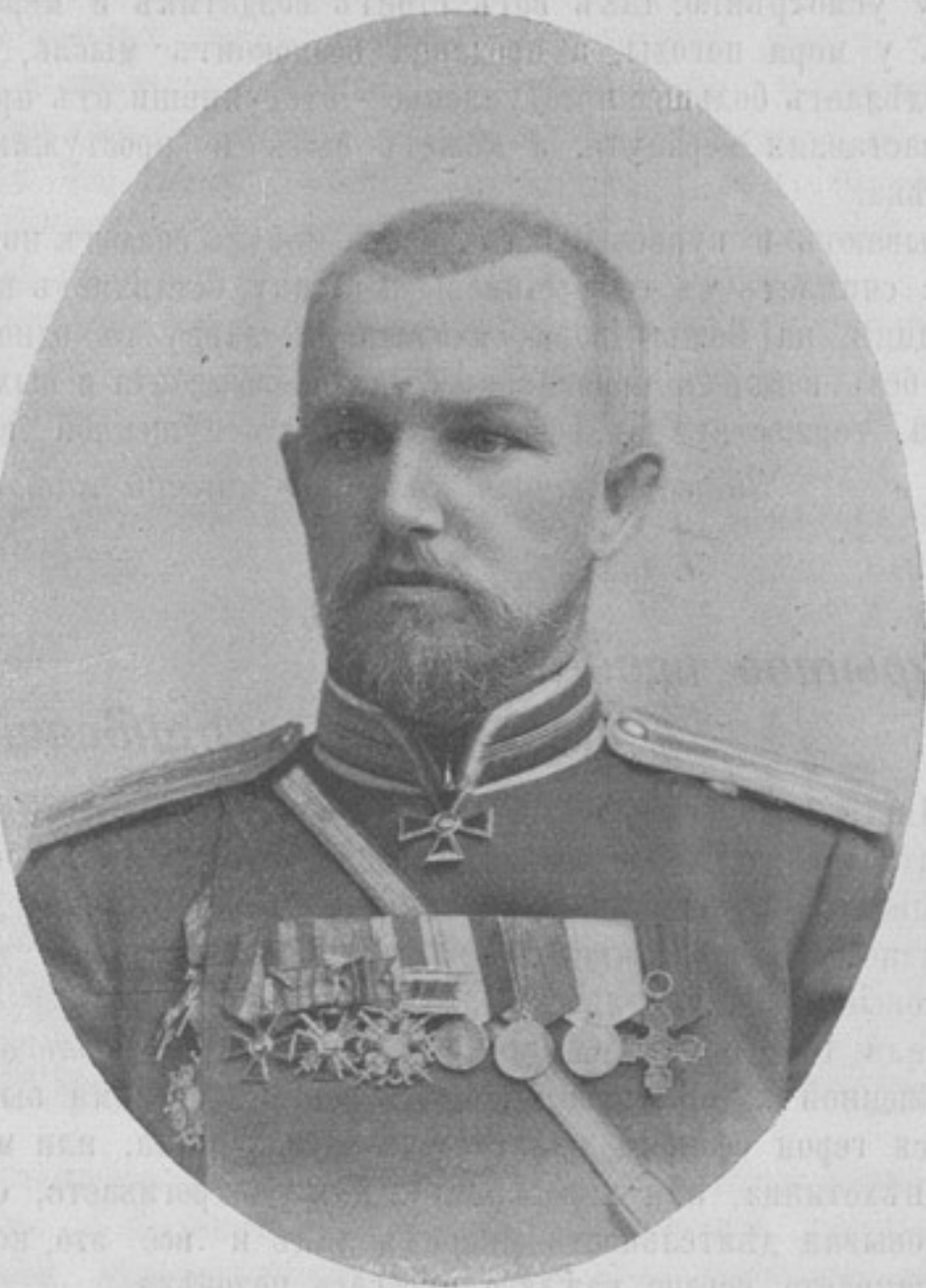
Командиръ 2-й бригады 9-й пѣх. дивизіи (10-го корпуса), генераль-маіоръ Леонтій Владиміровичъ Мартсонъ. Смертельно раненый въ бою подъ Лаояномъ 15-го августа, скончался въ Лаоянѣ 16-го августа 1904 г.

щенной ему въ лавкѣ сдачи отдаетъ по принадлежности лишь половину, остатокъ же причетъ себѣ; обиженный солдатъ, не