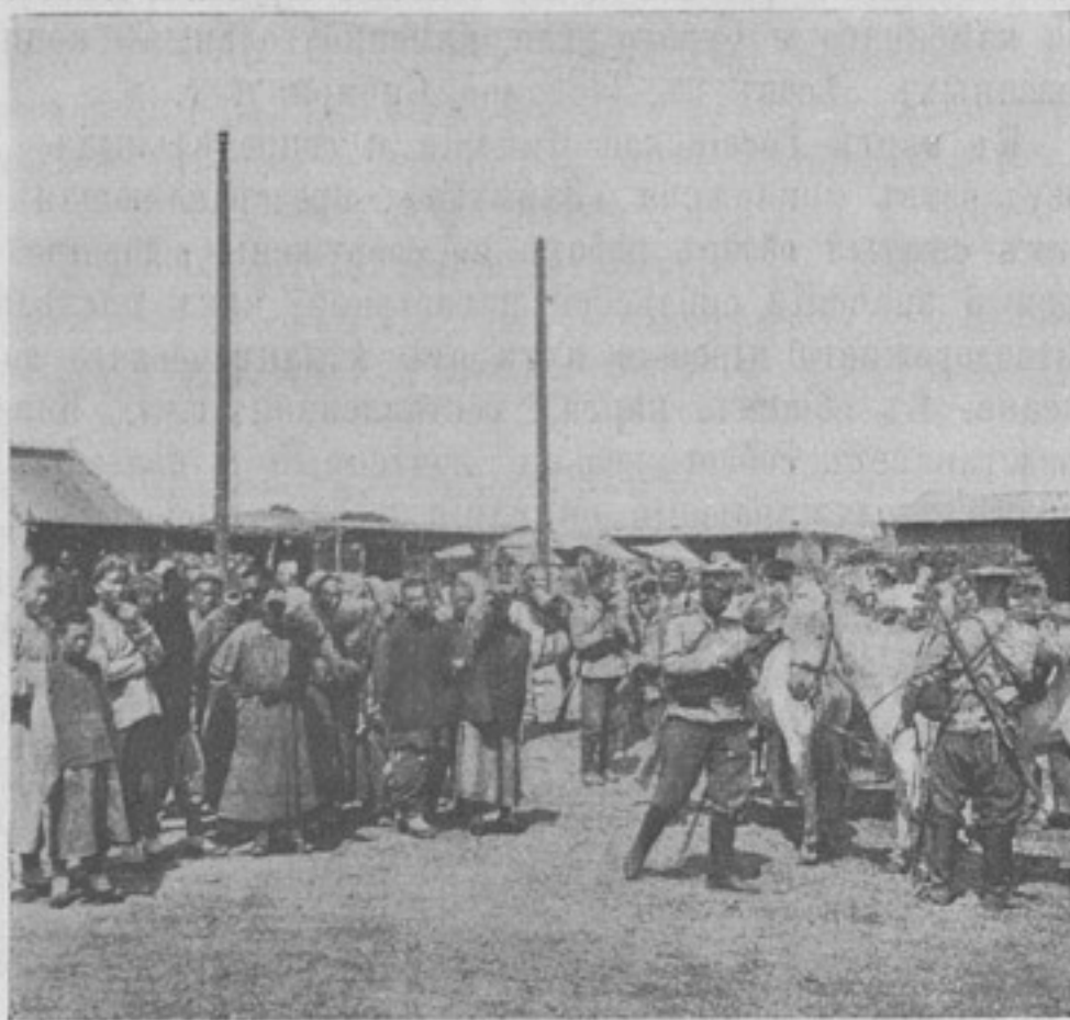
Разъездъ Пограничной стражи въ китайской деревнѣ.

японцевъ перекатила эти орудія во фронтальное положеніе и лишь послѣ сего приняла вызовъ (Японцы за это время пристрѣлялись уже).