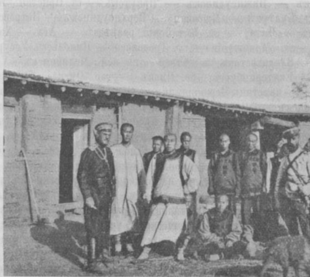
Офицеръ Пограничной стражи и китайскій офицеръ съ конвоемъ. (Фотогр. шт. ротмистра Карпова, собств. корресп.).

18 іюля, во время боя, ко мнѣ прибылъ Иркутскаго полка подполковникъ Лихачевъ, отходившій со своимъ баталіономъ въ общій резервъ; подполковникъ Лихачевъ мнѣ доложилъ, что 17 іюля наша артиллерія произвела чарующее впечатлѣніе на иркутцевъ и енисейцевъ, которые бодро, воодушевленно двинулись впередъ на свои старыя позиціи, за быстро утекшими японцами; подполковникъ Лихачевъ также заявилъ, что онъ лично наблюдалъ, какъ послѣ дѣйствій нашей 2-й батареи разлетѣлась артиллерія противника. Итакъ, явно, наша 2 батарея, 17 іюля, имѣла неоспоримый блестящій успѣхъ надъ превосходной въ численности артиллеріей противника на общую веѣмъ намъ пользу и въ частности на выручку товарищей. Дивная быстрота, превосходный результатъ есть послѣдствіе бдительности, усердія и любви къ дѣлу командира батареи подполковника Чарекова, его сотрудниковъ по батарее офицеровъ и молодцовъ нижнихъ чиновъ.