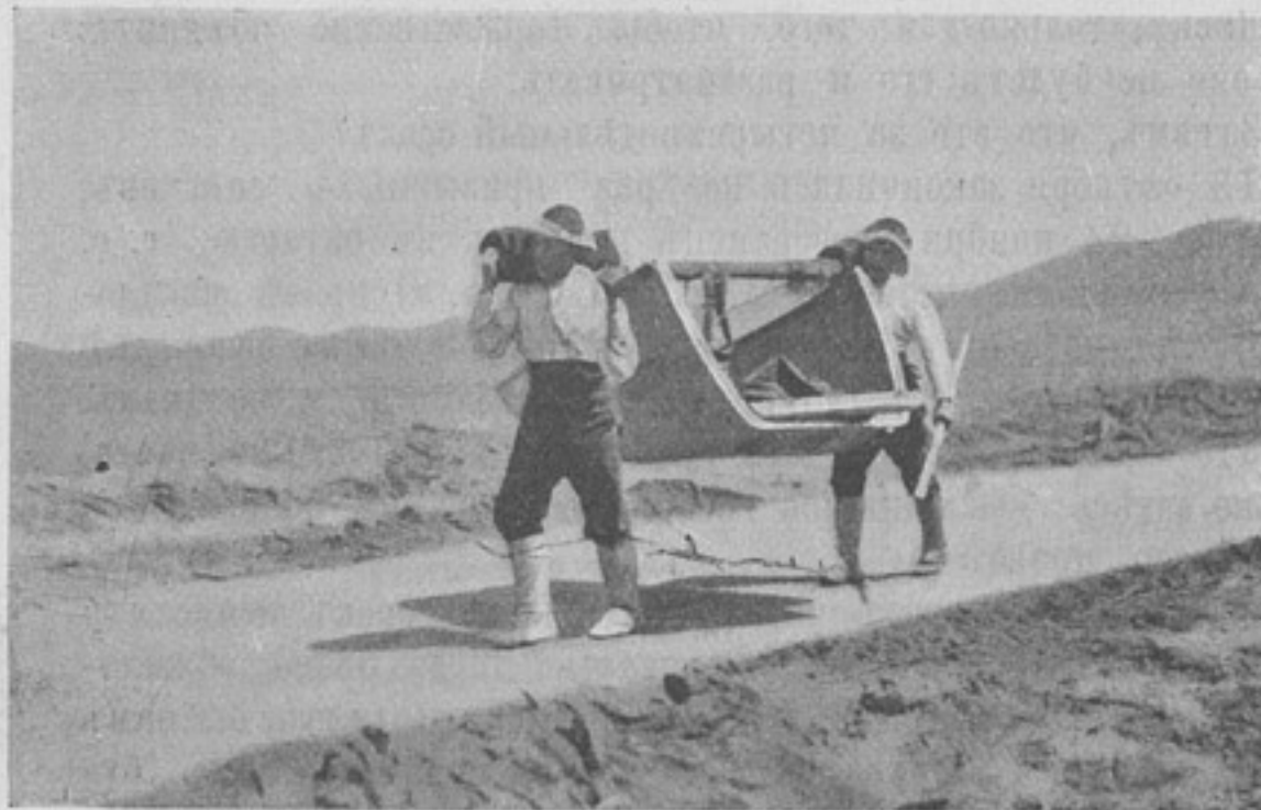
Переноска японцами части желѣзнаго понтона.