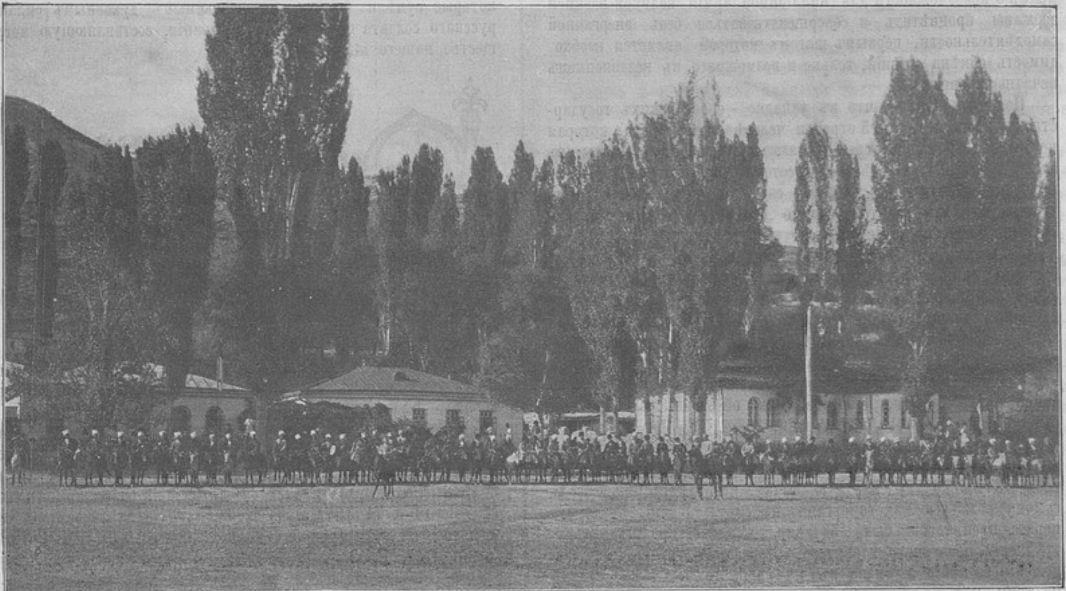
Къ Гунибскимъ торжествамъ на Кавказѣ. Депутация туземнаго поселенія въ конномъ строѣ, на Гунибѣ, передъ прїездомъ Намѣстника Е. И. В. графа Воронцова-Дашкова.

Напомнимъ нашимъ читателямъ, что «Развѣдчикъ» родился въ эпоху военнаго министерства генерала Ванновскаго—человѣка, мало склоннаго поощрять новаторства всякаго рода. Самая мысль о необходимости для арміи частнаго военнаго органа объявлена была ересью. «Для офицеровъ имѣется военная газета «Русскій Инвалидъ», и этого совершенно достаточно. Зачѣмъ имъ еще какая-то частная военная газета? Будетъ съ нихъ Инвалида», — вотъ какъ рассуждали руководители и воспитатели арміи того времени, подъ влияніемъ которыхъ у насъ и выросъ обширный командный составъ начальниковъ, о которыхъ обыкновенно говорятъ, что они «ничего кромѣ «Инвалида» не читаютъ». Насколько такіе на-