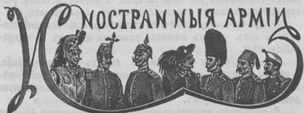
Германія («La France militaire»). Недавно въ

При настоящихъ условіяхъ Россія не мечтаетъ и не будетъ мечтать о какомъ-либо реваншѣ, что дѣлаетъ положеніе Японіи чрезвычайно выгоднымъ. Но допустимъ, что, не взирая на это, партія войны въ Японіи вовлечетъ ее въ войну съ Россіей; помимо того, что всякая война есть рискъ, Японія не должна при этомъ забывать, что такая война явится съ нашей стороны повтореніемъ 1812 года, но только не на Западѣ, а на Востокѣ. Допустимъ, что Японія выйдетъ изъ нея побѣдительницей, захватитъ часть нашей территоріи, и мы даже подпишемъ миръ, что крайне сомнительно, примѣромъ чему можетъ служить тотъ же 12-й годъ. Выгодно ли будетъ Японіи пріобрѣсти въ лицѣ насъ непримиримаго врага, съ слишкомъ стомилліоннымъ населеніемъ, у котораго будетъ одна только мысль объ отмщеніи, въ духѣ котораго будутъ воспитываться и молодые поколѣнія? А сотни тысячъ убитыхъ и изувѣченныхъ людей, а милліардные расходы, а проклятія, которые будутъ вызваны всѣмъ этимъ, — равнѣ ли должны заставить задуматься прежде, чѣмъ рѣшиться на войну?!