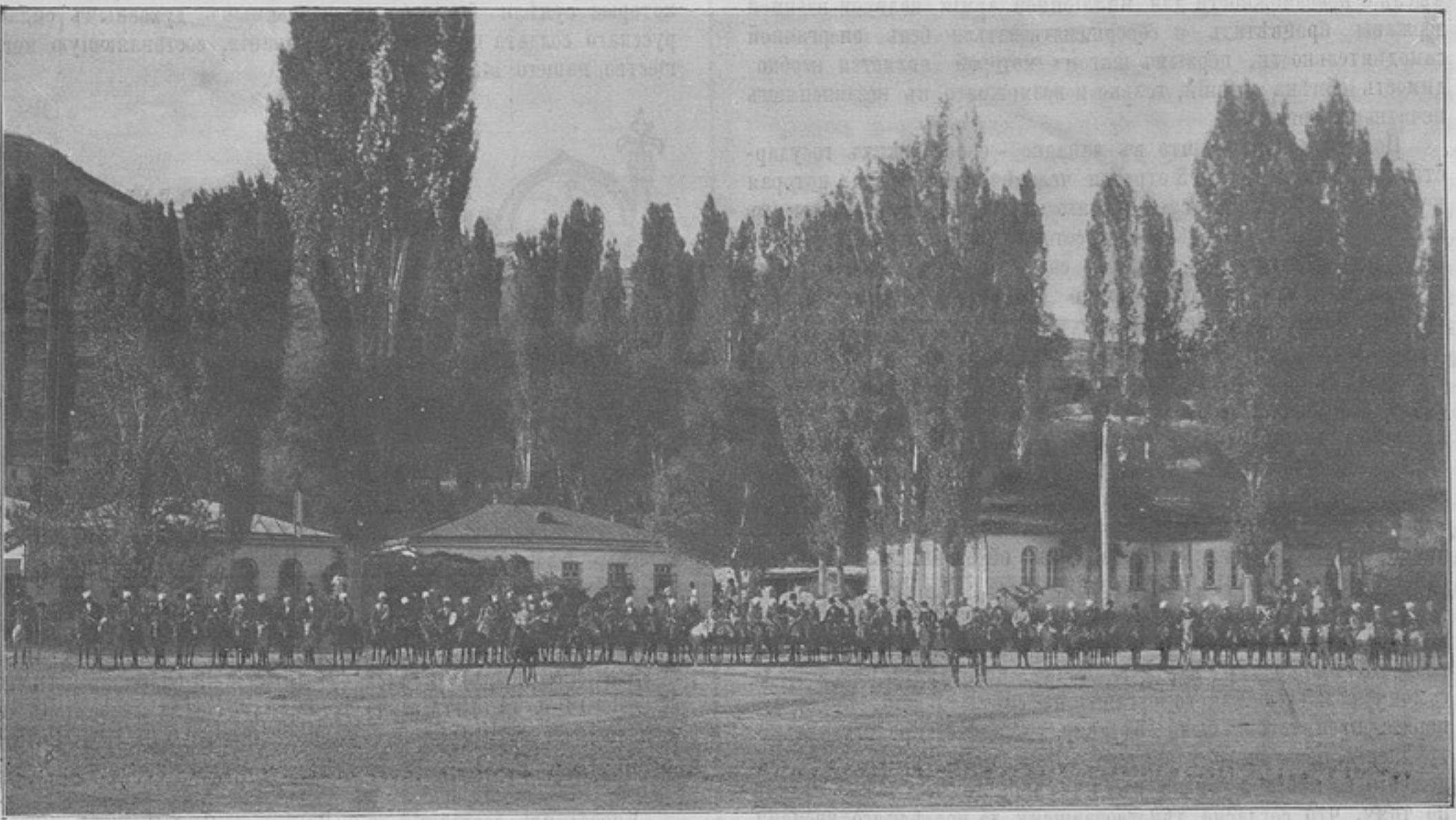
Къ Гунибскимъ торжествамъ на Кавказѣ. Депутатія туземнаго поселенія въ конномъ строѣ, на Гунибѣ, передъ прїѣздомъ Намѣстника Е. И. В. графа Воронцова-Дашкова.

Напомнимъ нашимъ читателямъ, что «Развѣдчикъ» родился въ эпоху военнаго министерства генерала Ванновскаго—человѣка, мало склоннаго поощрять новаторства всякаго рода. Самая мысль о необходимости для арміи частнаго военнаго органа объявлена была ересью. «Для офицеровъ имѣется военная газета «Русскій Инвалидъ», и этого совершенно достаточно. Зачѣмъ имъ еще какая-то частная военная газета? Будетъ съ нихъ Инвалидъ», — вотъ какъ разсуждали руководители и воспитатели арміи того времени, подъ влияніемъ которыхъ у насъ и выросъ обширный командный составъ начальниковъ, о которыхъ обыкновенно говорятъ, что они «ничего кромѣ «Инвалида» не читаютъ». Насколько такіе на-