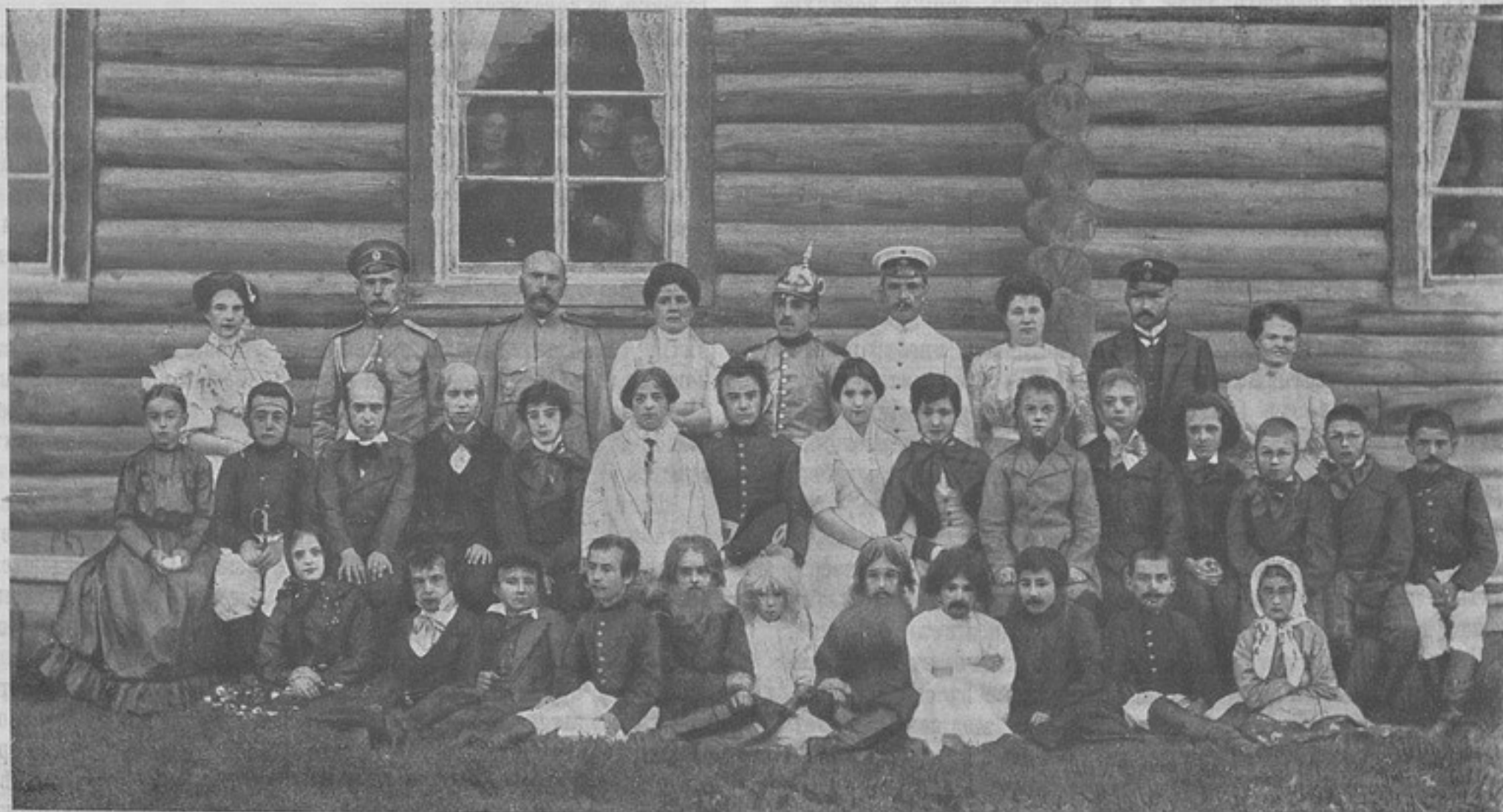
Къ корр. «Сахалинь».

Для повѣрки зимнихъ тактическихъ занятій и для выясненія на практикѣ теоретическихъ соображеній, было предложено