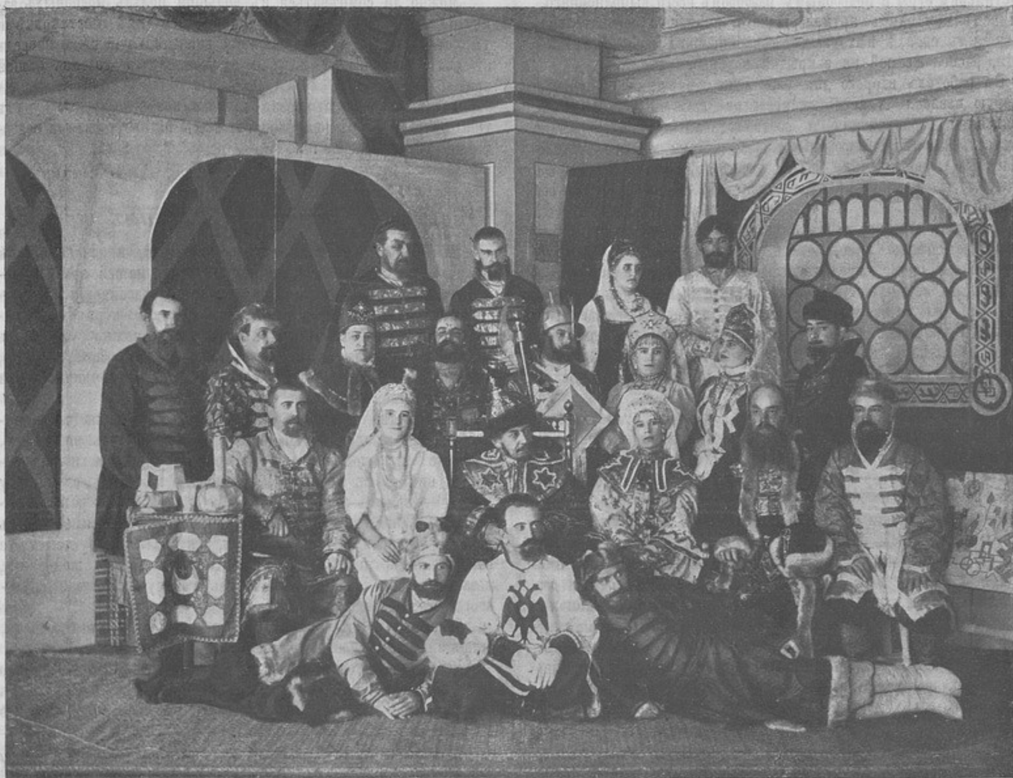
Къ корр. «Сахалинъ».

участникамъ игры разработать и представить ко дню выступления въ поле слѣдующія письменныя работы: