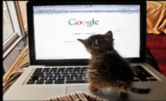
What my friends think I do