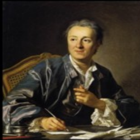
What I think I do