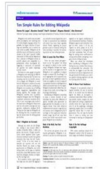
Este ensaio em formato

Para o bem ou para o mal, as pessoas são levadas à Wikipédia ao procurar na Web por informação biomédica. [2] Então, há uma necessidade crescente de a comunidade científica se envolver com a Wikipédia para assegurar que a informação contida nela seja precisa e atual. Para cientistas, contribuir para a Wikipédia é uma excelente forma de engajar-se com a sociedade e compartilhar expertise. Por exemplo, alguns cientistas wikipedistas integraram, com sucesso, informações biológicas à Wikipédia para promover notas explicativas pela comunidade. [3][4] Isto, por sua vez, encoraja um acesso maior às informações linkadas via Wikipédia. Outros utilizaram o modelo wiki para desenvolver seus próprios bancos de dados colaborativos e especializados. [5][6][7][8] Dar seus primeiros passos na Wikipédia pode ser intimidante, mas aqui fornecemos