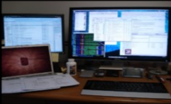
What my family thinks I do