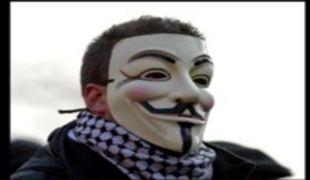
What society thinks I do