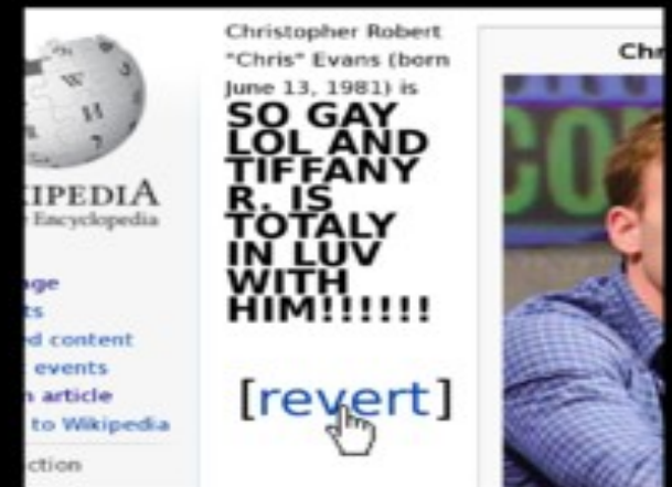
What I actually do