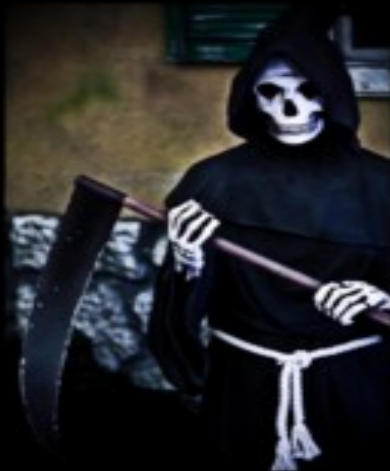
What the publishing industry thinks I do