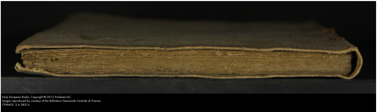
CFMAGL 2.6.385/a