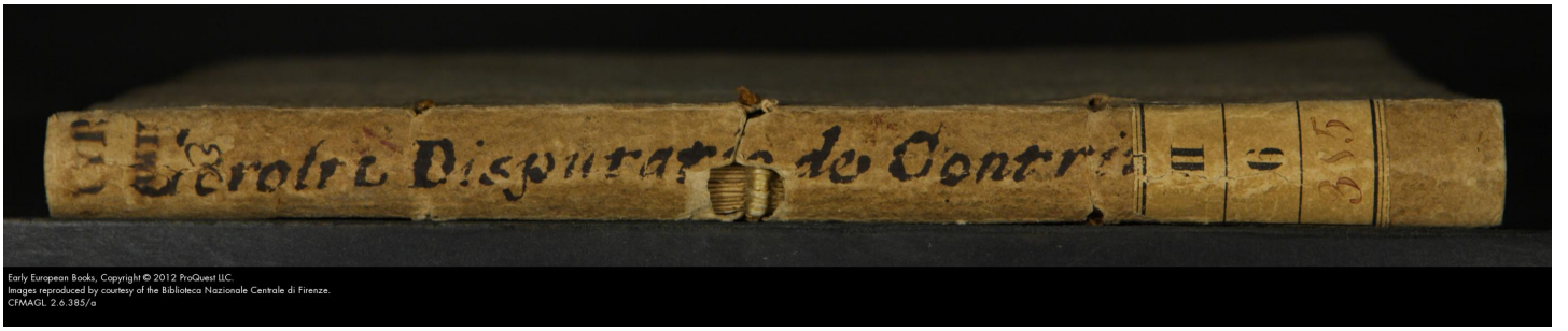
Early European Books. CFMAGL 2.6.385/a