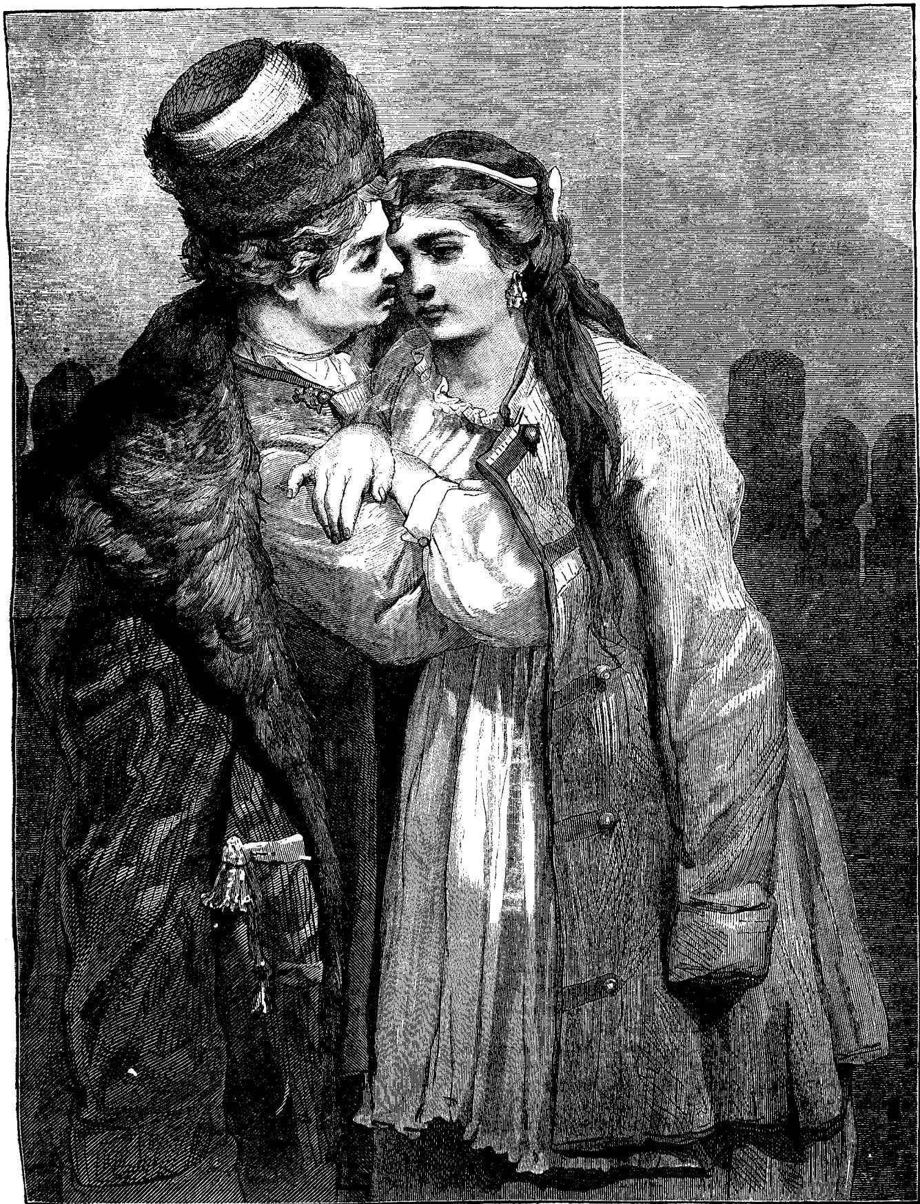
Logodiți din Rusia mică.