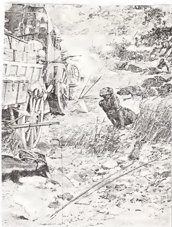
GEN-LAGER IN DE MATABELE-OORLOGEN