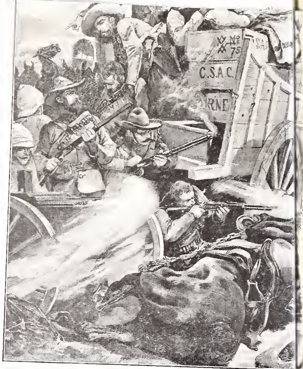
PROEVE VAN ILLUSTRATIE: AANVAL OP EE