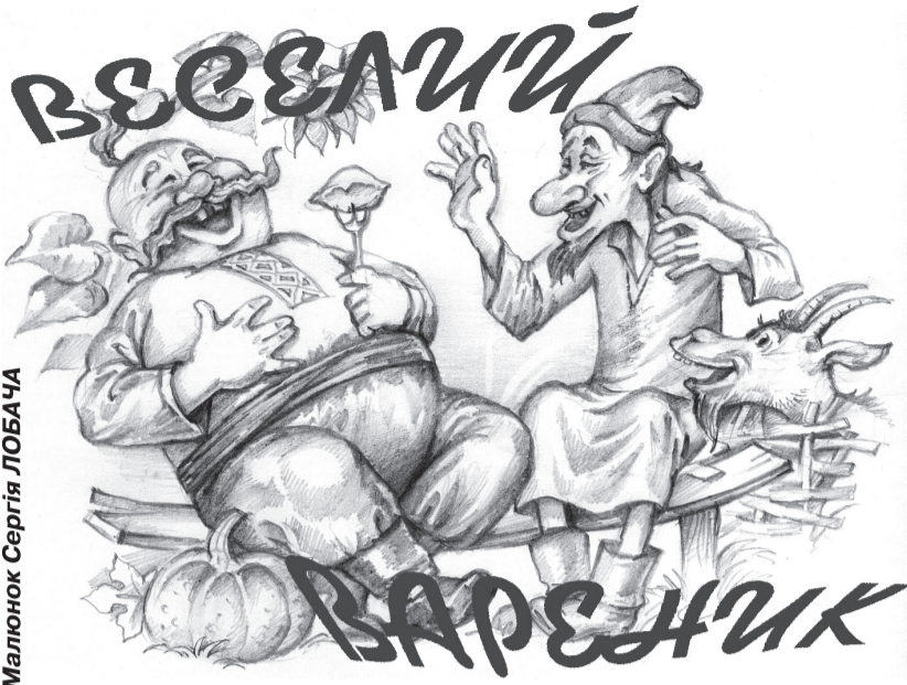
Малюнок Сергія ЛОБАЧА