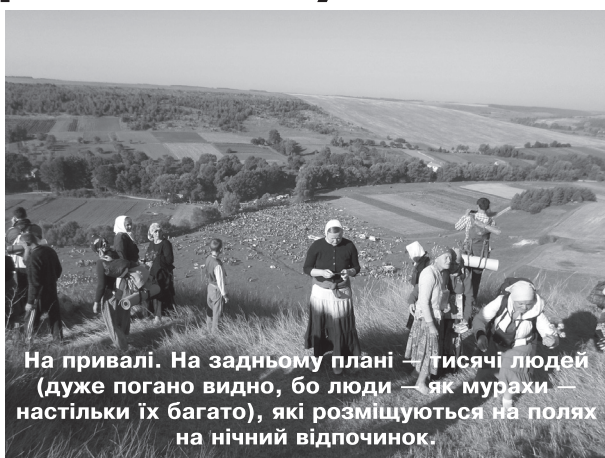
На привалі. На задньому плані — тисячі людей (дуже погано видно, бо люди — як мурахи — настільки їх багато), які розміщуються на полях на нічний відпочинок.