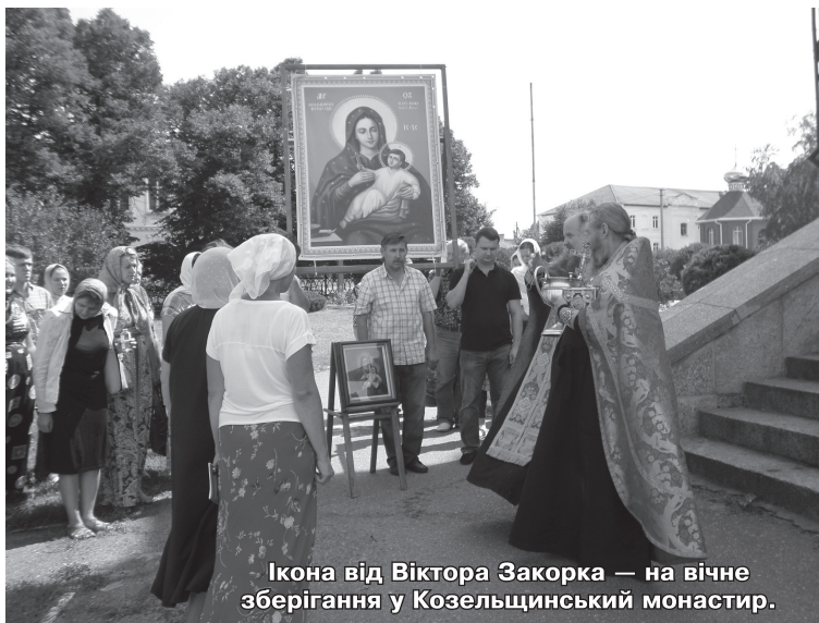
Ікона від Віктора Закорка — на вічне зберігання у Козельщинський монастир.