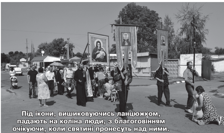
Під ікони, вишикувавшись ланцюжком, падають на коліна люди, з благоговінням очікуючи, коли святині пронесуть над ними.