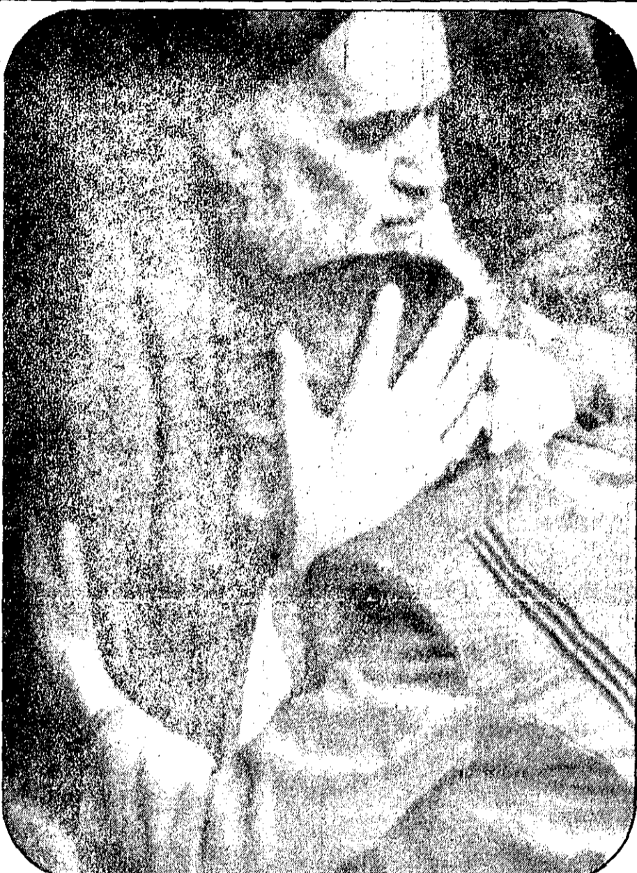
با نسل آینده- کودکی مشتاقانه به دیدار امام شتافته است. امام نماینده‌ای از نسل آینده را در آغوش میفشارد. کودک شوق زده به گریه افتاده است.

دکتر بنی‌صدر در دومین روز سخنرانی در دانشگاه صنعتی: بانک‌ها روت ملت را میمکنند