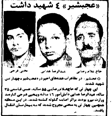
عجمشیر «ع شهادت»

تسلگرام شورای همبستگی بابل به امام خمینی