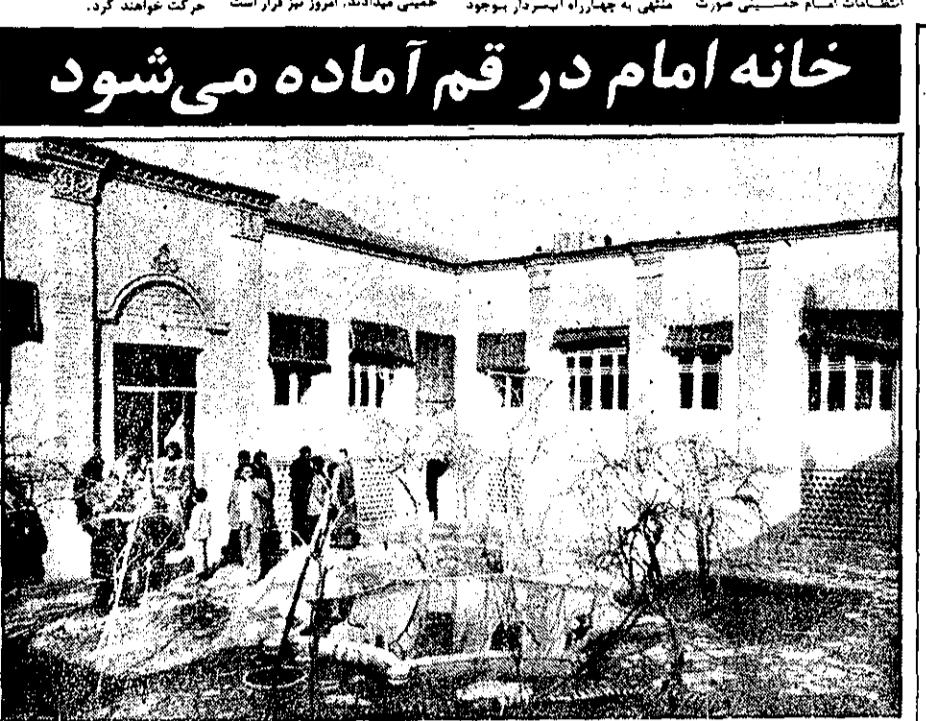
خانه امام منزل حضرت آیتالله العظمی خمینی در قم برای اقامت آینده ایشان نوسازی می‌شود. هر روز گروهی از طبقات مختلف مردم از اقامتگاه امام، دیدن می‌کنند.

وقتی کلیه بنیادهای کهنه و ارتجاعی سیاسی کشور براساس قدرت ملت و نفی دردی حاکمیتی تسلط دارد، وقتی مردم همچنان در قبال حکومت مطلق و دولت گروه‌گروه در حیاتیان گشته می‌شوند و خانه و زندگی آنها در آتش کشیده می‌شود و امور حیاتی کشورسوی یک پارلانی می‌گردد، اینبار در این حالت در دولت در امور خود ندارد، دولت آقای بختیار از نظر قانونی و در حقیقت و حاکمیتی، این است که در این مورد از دولت در امور خود ندارد.