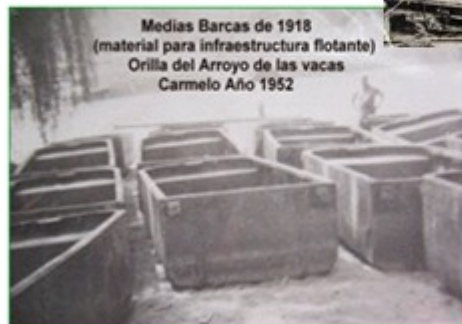
Medias Barcas de 1918 (material para infraestructura flotante) Orilla del Arroyo de las vacas Carmelo Año 1952