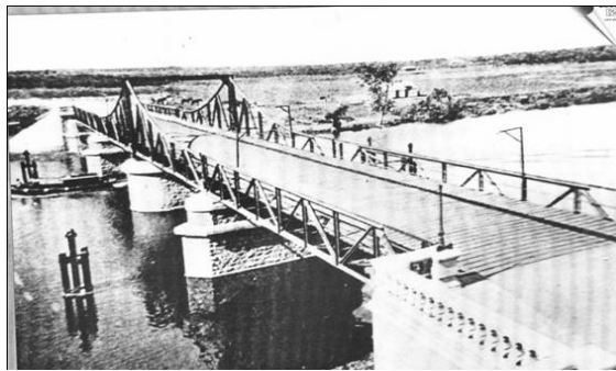
Vista del puente, antes.

“Extraído de 100 años uniendo orillas de Eraldo Bouvier”