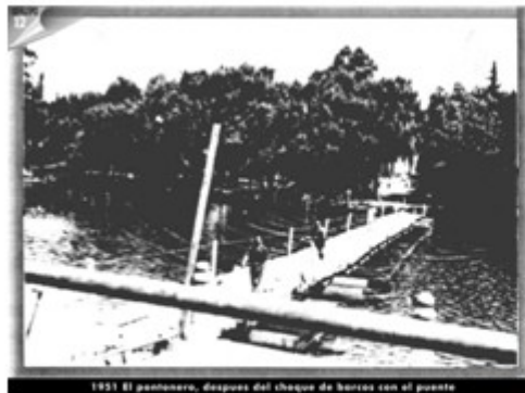
1951 El pontonero, después del choque de barcos con el puente

A continuación compartimos unas fotos del accidente y del pontonero, también de los materiales usados para armar el pontonero: