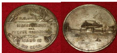
Medalla conmemorativa de la Inauguración del puente giratorio

“Extraído de 100 años uniendo orillas de Eraldo Bouvier”