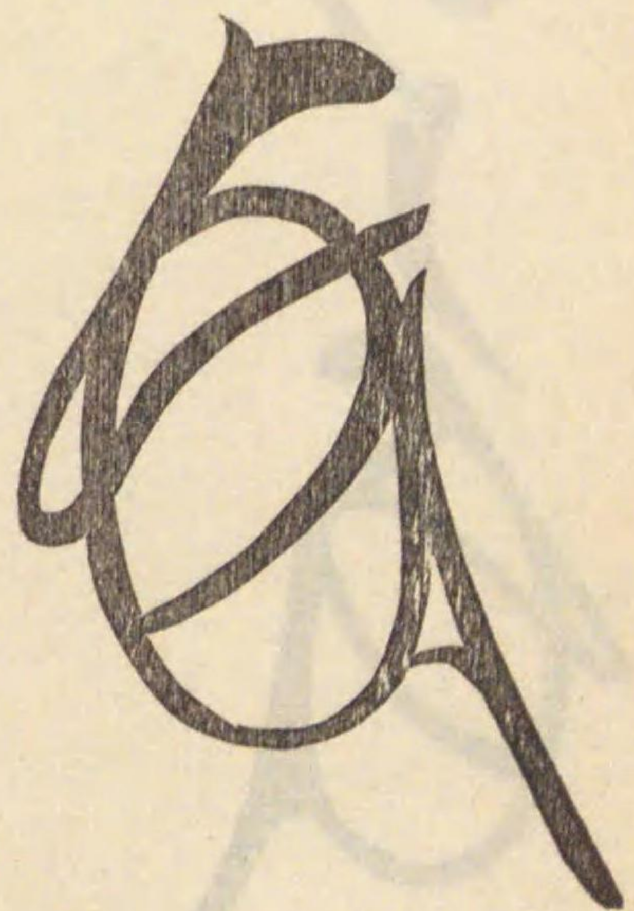
○東寺文書 (山城) 貞和四年八月日奉加狀