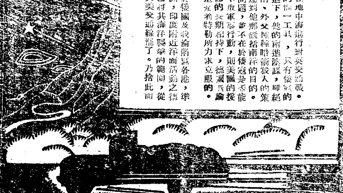
印編處海管路公陸與商通交X版此日七十月一年十三國民華中