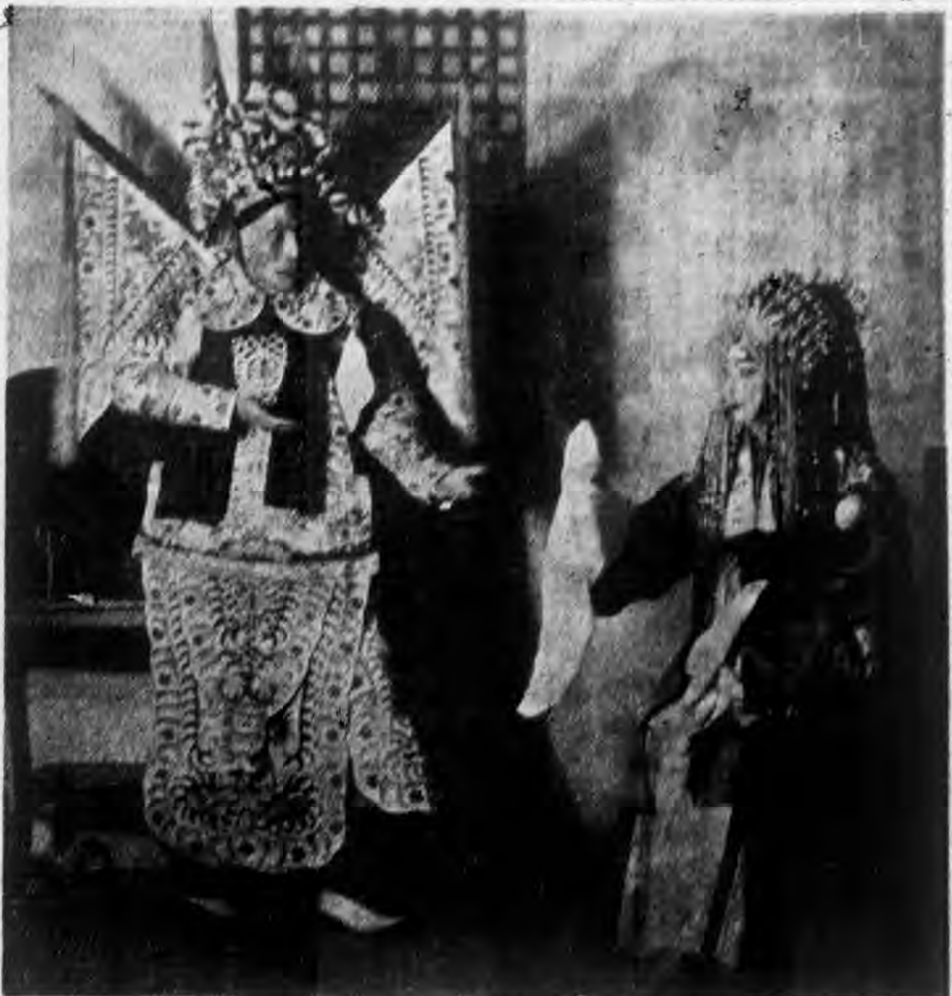
梅院君與楊小樓之長板坡