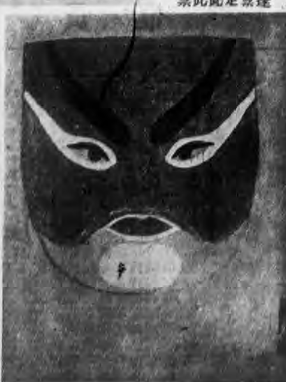
綴玉軒所藏明代臉譜之十二——龐德

不用墊子，但京戲台上，一切脚色叩頭，其膝或恐塵土污染其新行頭，而設此例。但叩頭之時，腳下必有一物，即墊子也。鄉間戲台上，凡一切脚色叩頭，不用墊子，但京戲台上，一切脚色叩頭，其膝或恐塵土污染其新行頭，而設此例。但叩頭之時，腳下必有一物，即墊子也。