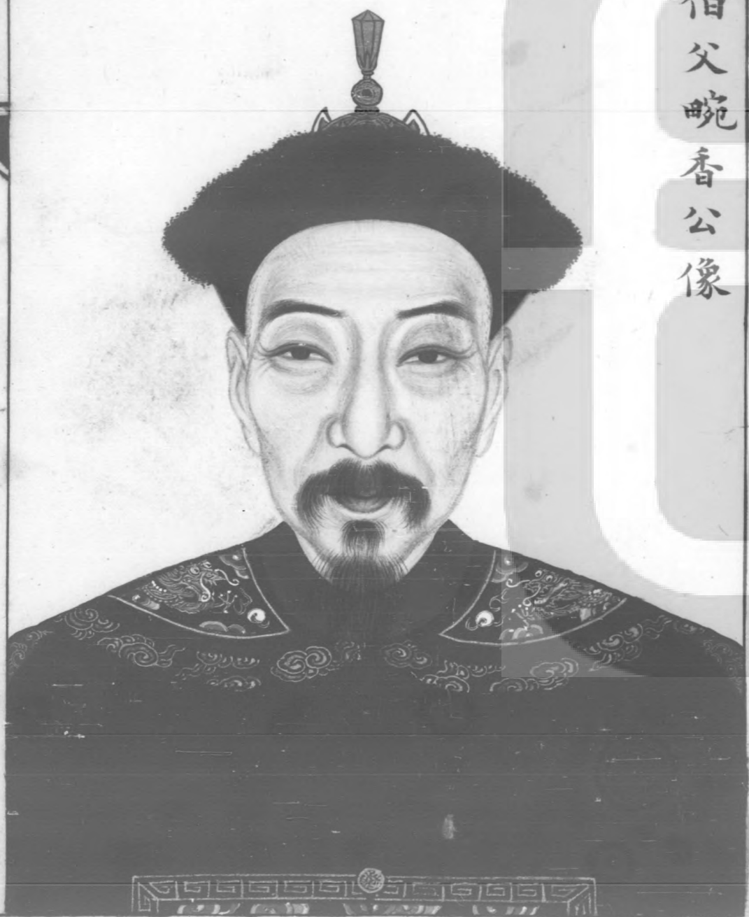
十一世伯父畹香公像