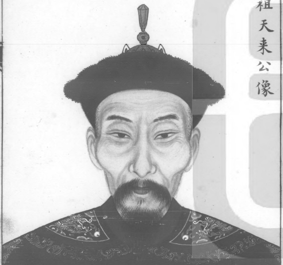
十世嗣祖天來公像