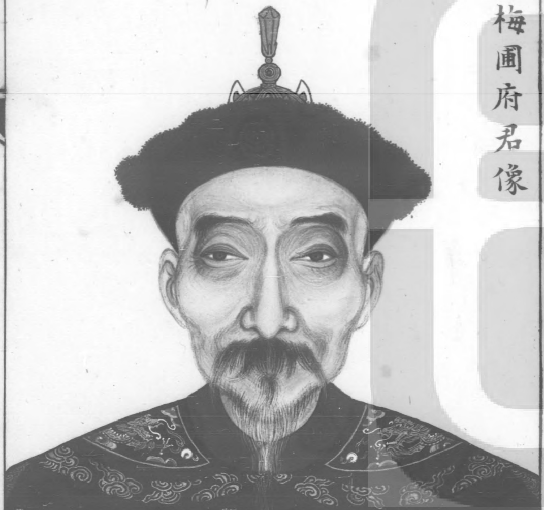
十一世梅圃府君像