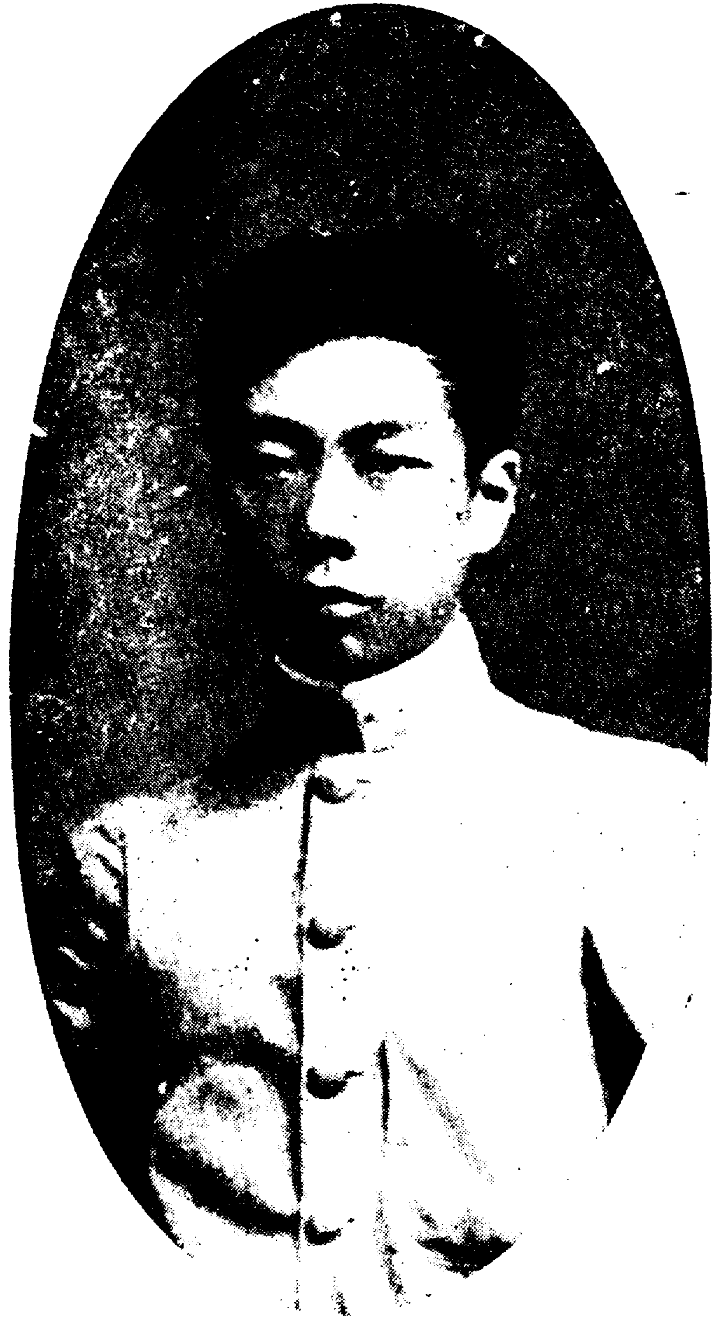
二十四歲攝於東京