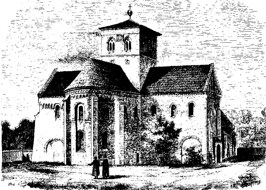
St. Pents Kirke i Ringsted.

Dg midt imellem begge, hvor dit Die Kun seer en sprukken afflidt Marmorsteen, Der du dit Kne i hellig Andagt bøie, Thi Stenen gjemmer Volmer Seiers Been. Den største, Danmark fæstet, her bevarer Den danske Jord udi sit Moderkjød, Den største selv blandt store Baldemarer, Den Drot, som blev til Seir og Lykke fød.