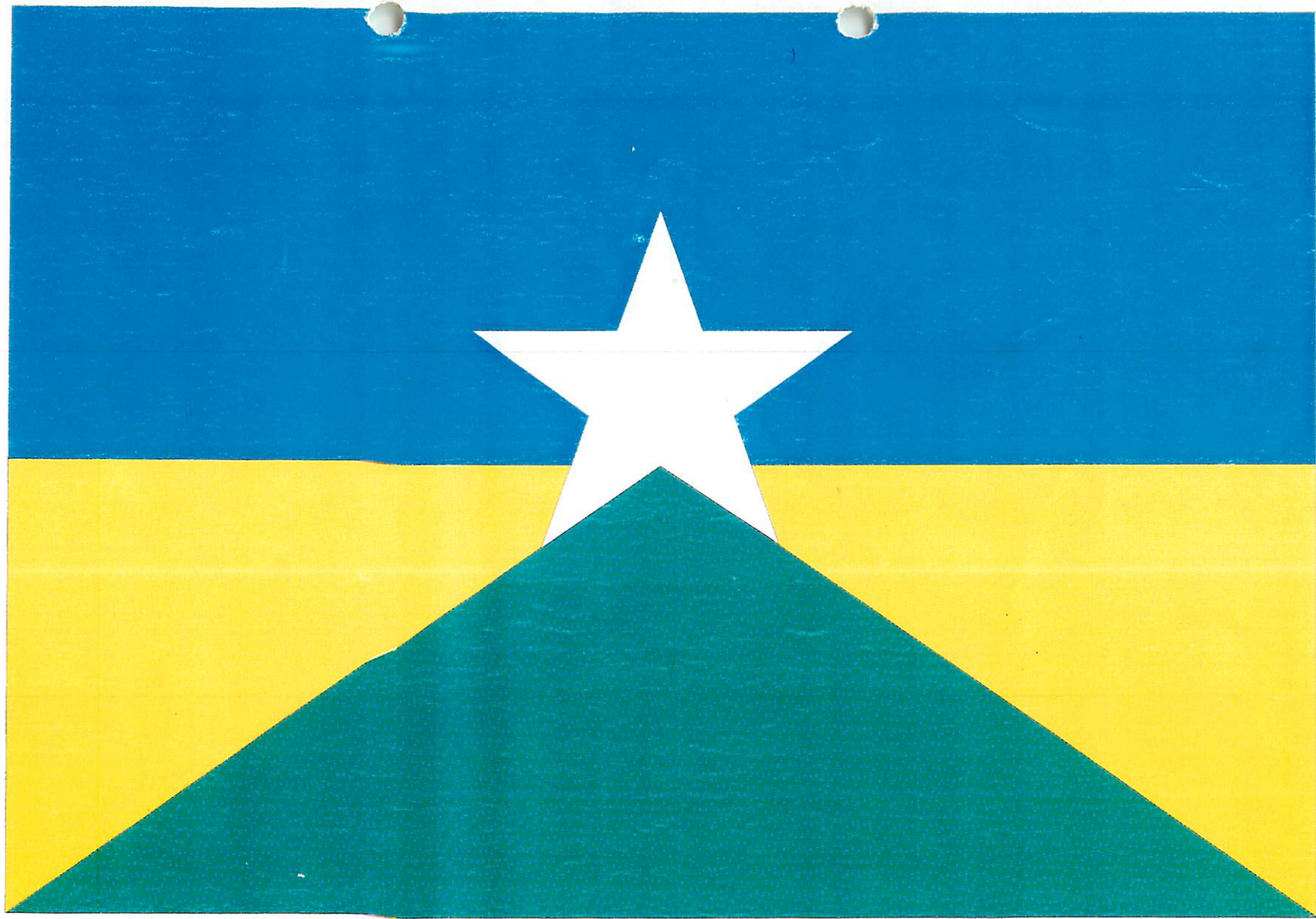
BANDEIRA DO ESTADO DE RONDÔNIA