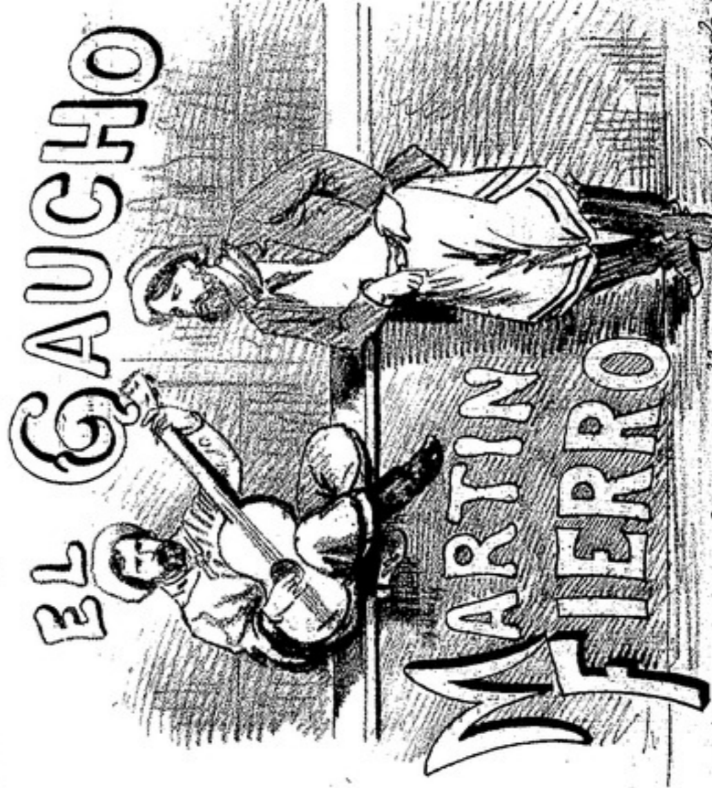
Una marca de cigarrillos que ya avanzando la popularidad de otro cuyo título lleva.