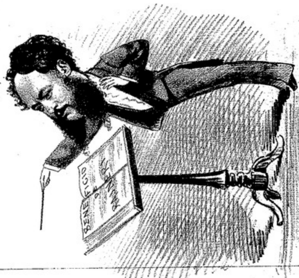
Al Lunes a Color lo abo, bien lo merece el simpático maestro.