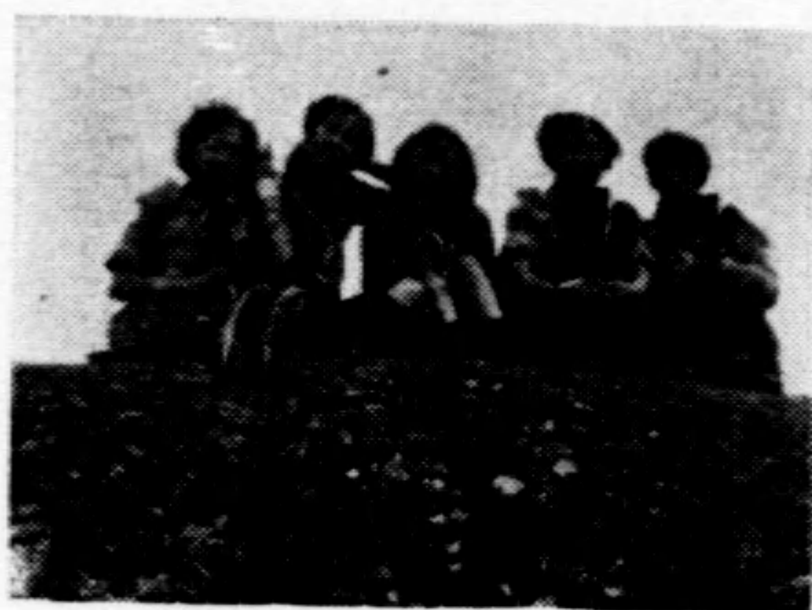
中文旗語 周 滿 高素英 胡瑞瑛 朱 露芬