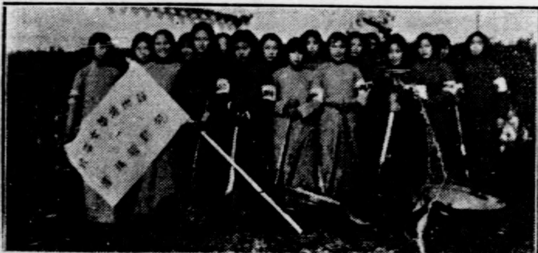
勞動服務社準備出發時攝影