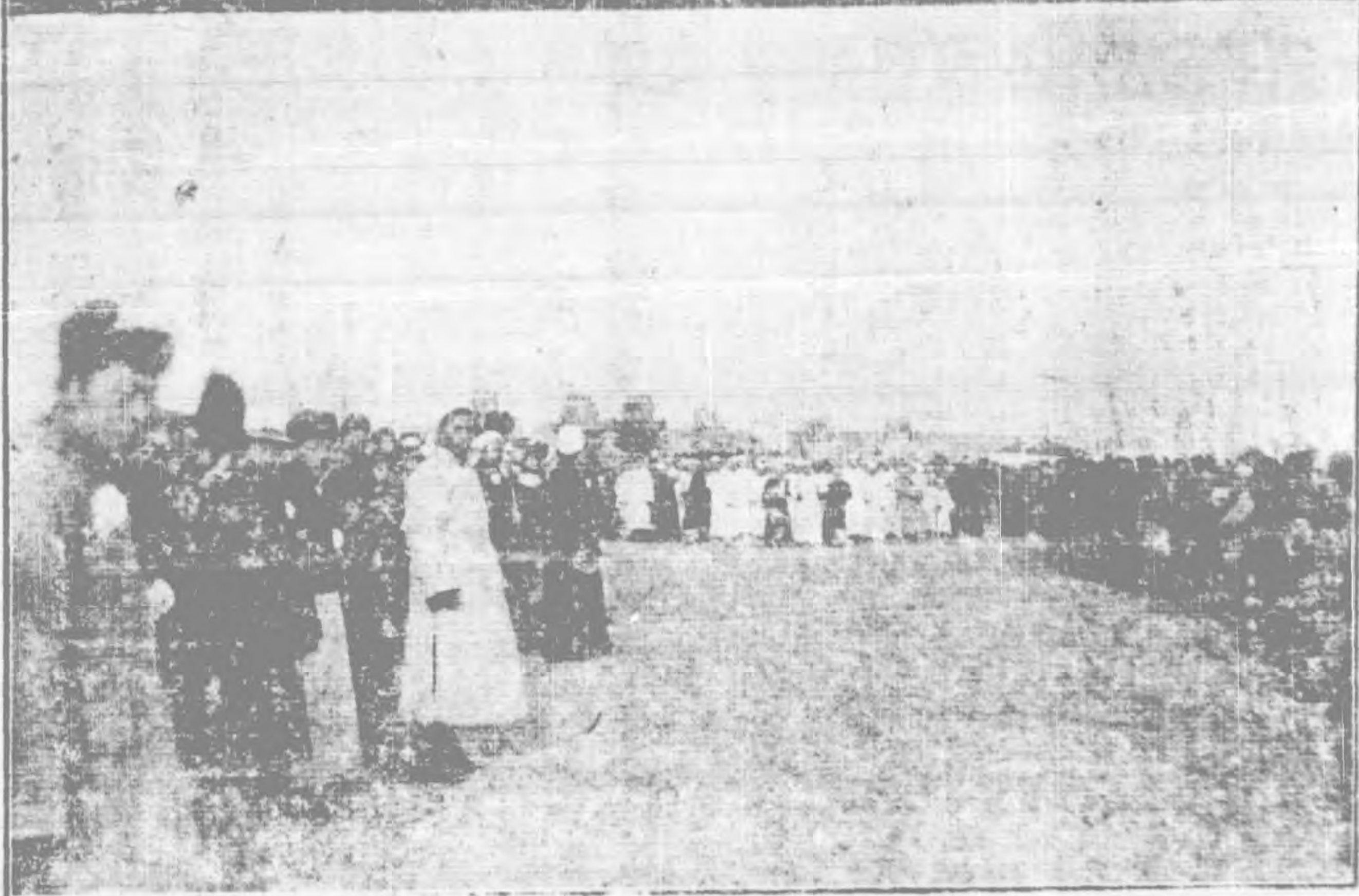
【事紀期本見】儀喪之人夫太生瑞馮

，——證據——，並且可以收到相當的紅 息，（自然關於利息的分配量，單位等， 是需要更精密的去制定。）但是在這裏面 還應有兩個互相不能違反的原則存在：（1） 應以不損失最少投資者的最小限度的利息 以維持合作社之信用，與獎勵其繼續投款 。（2）合作社在整個經濟會的經濟計劃下進 行，完全受經委會意識的支配而進行其合 作社發展事宜。（如物品之銷售，產品之 性質，原料之購買，銷路，貸款等。）