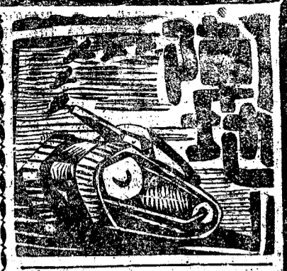
歡迎 NO.257 投稿