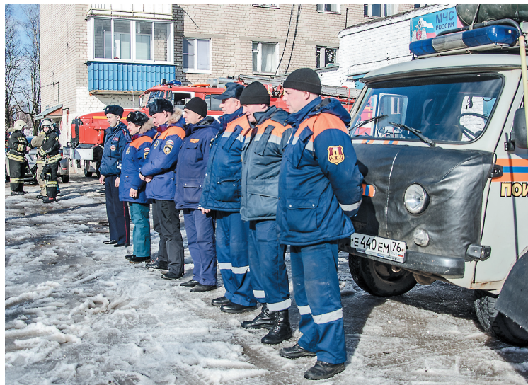
Расчеты спасателей готовы к любым чрезвычайным ситуациям