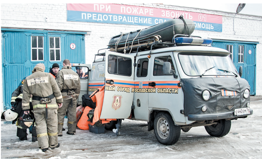
Автомобиль спасателей укомплектован всей необходимой техникой