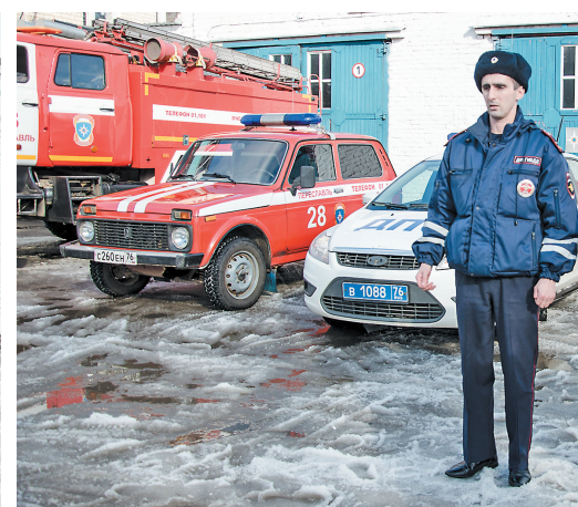
Экипажи ДПС призваны сопровождать эвакуационные колонны и охранять оставленное гражданами имущество