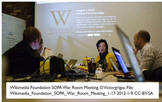
Wikimedia Foundation SOPA War Room Meeting. File: Wikimedia_Foundation_SOPA_War_Room_Meeting_1-17-2012-1-9. CC-BY-SA

Simpel! Ga naar een Wikipedia pagina en klik op bewerken. Voeg informatie toe aan een bestaand artikel, corrigeer een fout, verbeter de taal of schrijf een nieuw artikel over een onderwerp dat nog niet in Wikipedia staat. Wikipedia is zo ontwikkeld dat iedereen een artikel kan bewerken of schrijven. Er is een handleiding en er zijn online cursussen, uitgebreide hulpfuncties en oefenpagina's. Daarnaast zijn er ervaren Wikipediaaners die je graag met raad en daad bijstaan. Om communicatie met andere bewerkers makkelijker te maken kun je een account aanmaken met een zelfgekozen gebruikersnaam. Meer weten? Ga naar Wikimedia Commons en download de meest recente versie van de ' Handleiding Wikipedia '.