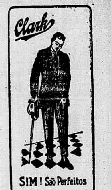
SIM! São Perfeitos