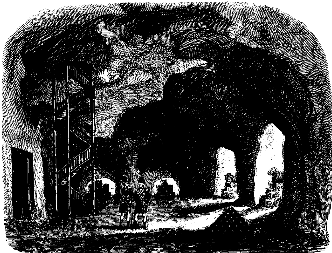
Casematte i Gibraltars Fæstning.