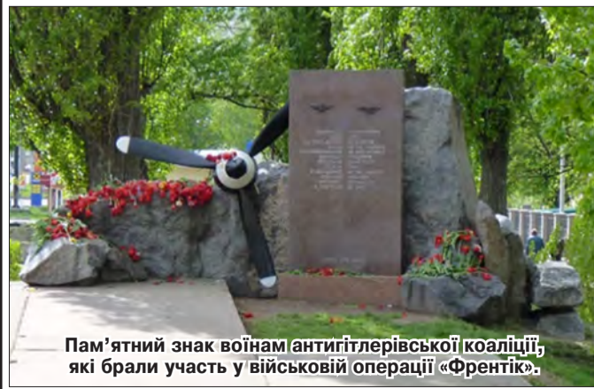
Пам'ятний знак воїнам антигітлерівської коаліції, які брали участь у військовій операції «Френтік».