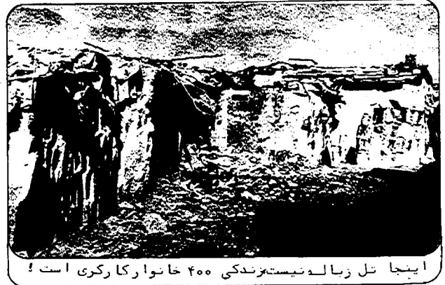
اینجا تل زیاده نیست زندگی ۴۰۰ خانوار کارگری است!

زحمتکشان محله حلبی-آباد (دباغانه) در جنوب شهر شیراز، خواستار رسیدگی سریع به مشکلات متعدد خود هستند. اغلب ۴۰۰ خانواده ساکن این محله از دشمن زیاری (دهی در نزدیکی شیراز) و مشایخ در ۱۶ فرسخی شیراز به این حلبی آباد پناه آورده اند و اکنون زندگی خود را با کار روز مزد مردان و کودکان در کارهای ساختمانی می گذرانند. از بهداشت عمومی، آب لوله کشی، حمام، پزشک و درمانگاه در این محله خبری نیست. محله دارای یک شورای محلی است که هر ماه ۱۸ لیتر نفت و مقدار کمی برنج و روغن به هر خانواده می دهد، اما این مقدار کفاف زندگی هیچ خانواده ای را نمی دهد. تنها مدرسه ۵ کلاسه محله از طرف جهاد سازندگی ساخته و برق محله هم با همیاری ساکنین کشیده شده است. چند شیر آب در سطح محله وجود