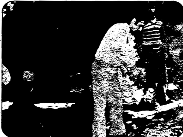
می سازند و با ساختن هروسيله و قطعه های، ضربه ای بر آپریاتیسیم وارد می کنند