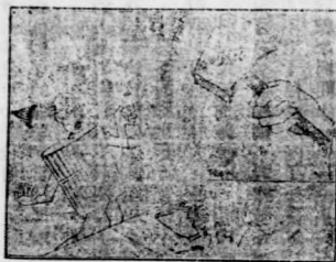
□ 生先郭南的下度制設考 □