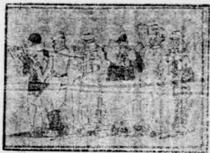
現代社會上行書的報

(1)小孩子向媽說：我肚子痛，能有糖菓喫，就可好了。其實他那裏是肚子痛，分明是要吃糖菓呵！