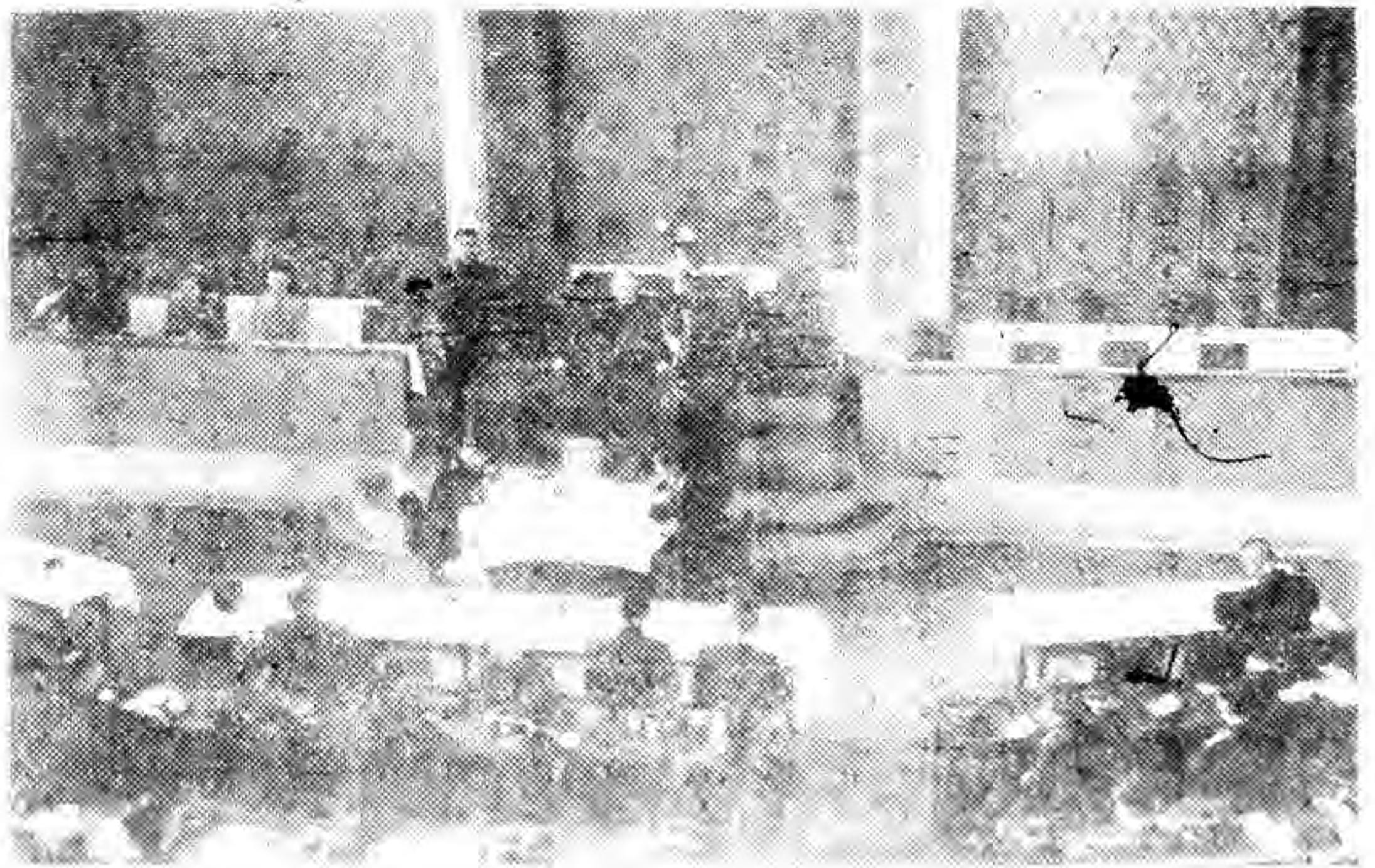
三 被 炸 毀 的 房 屋