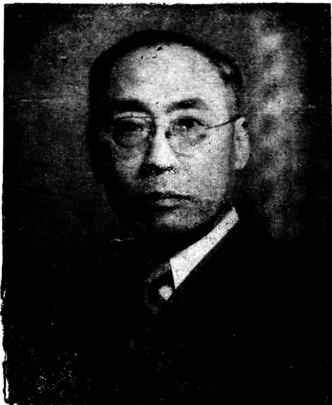
像肖生先勤君張席主黨本