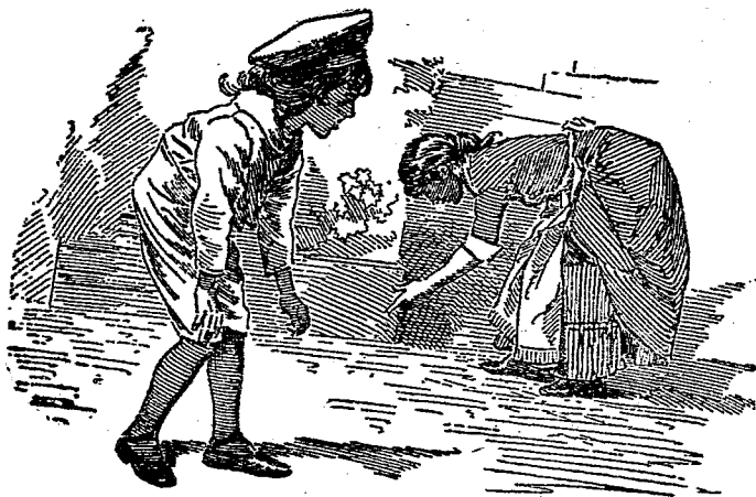
小 鉛 兵

穿了制服。是不應該大聲 叫喊的。所以閉住了口。始 終不響。他們找不到我也 就去了。