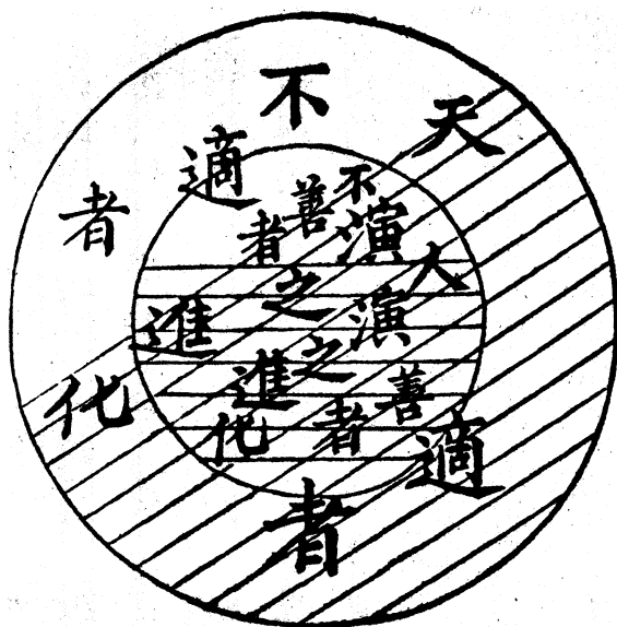
理想的天人共演 (第三圖)