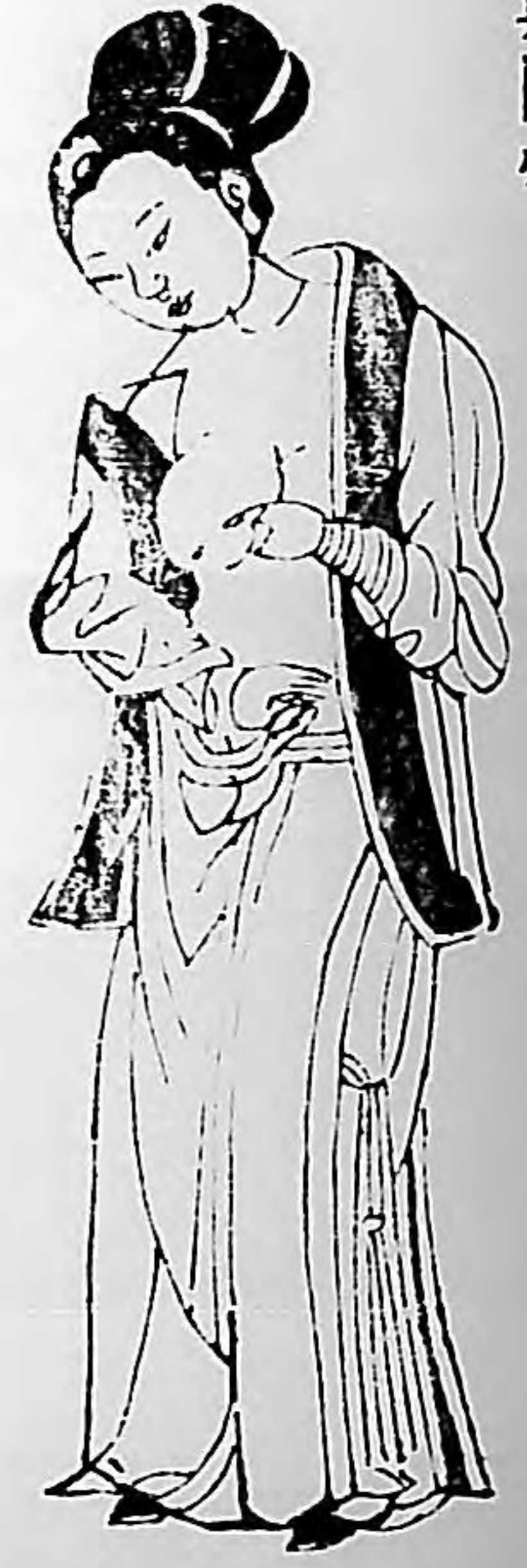
婦人咳嗽方論第十一 九九方

夫婦人咳嗽者。皆由肌腠虛外。受於寒熱風濕。所得也。肺為四臟之華。蓋內統諸臟之氣。外合於皮毛。若為寒熱風濕所傷。邪氣自皮毛而入於肺。則中外皆傷。故今咳也。大抵治