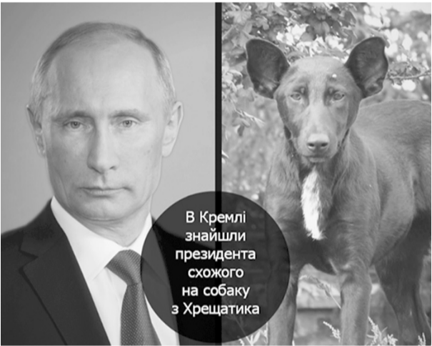
В Кремлі знайшли президента схожого на собаку з Хрещатика

Як добре, що москалі на весь світ продемонстрували, що вони не тільки брехуни, але їм чхати на думку всього світу. Але ми пам'ятатимемо: ніякого олімпійського вогню на т. зв. Олімпіаді у Сочі не буде, а буде вогонь від запальнички фессбешника.