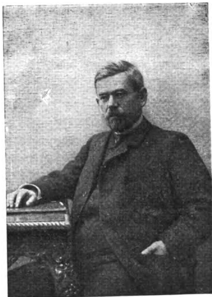
Akad İsmail Paşa