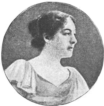
Королева Наталия, супруга Милана, мать короля Александра.