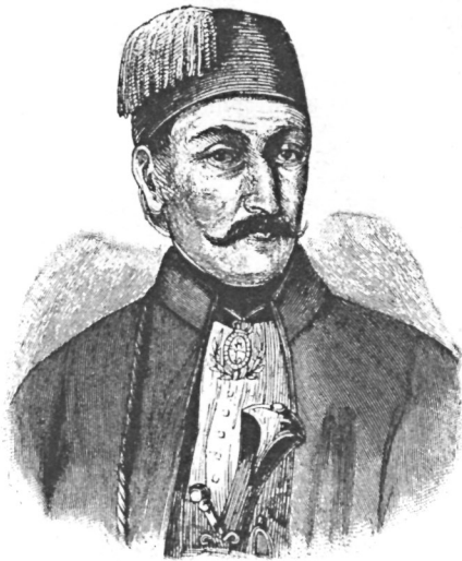
Милош Обреновић, князь Сербии съ 1817—1843 гг.

— Ну, положимъ, Александръ Александровичъ, это вздоръ,—сказалъ Самойловъ,—у насъ есть какія угодно свиньи!