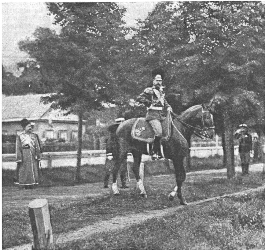
Его Императорское Величество Государь Императоръ на парадѣ л.-гв. Конногренадерскаго полка 1-го іюня.

Симптомы французской революціи, начинавшіе появляться въ концѣ царствованія Императрицы Екатерины II, нѣсколько охладили либеральный пылъ русскіихъ петиметровъ. Они перестали разсуждать о правахъ человѣка по Вольтеру и Жанъ-Жаку Руссо, но мода на французскую роскошь не уменьшилась, а напротивъ увеличилась, чему не мало способствовали начинавшіе прѣзжать изъ Франціи эмигранты; въ особенности ихъ было много въ Петербургѣ и Москвѣ. Русскіе вельможи приняли изгнанниковъ очень радушно: въ каждомъ изъ нихъ они видѣли самагаго элегантнаго петиметра, хотя въ числѣ французскихъ эмигрантовъ было не малое число шарлатановъ и проходимцевъ, служившихъ и нашимъ, и нашимъ, то-есть и королю Людовику XVI, и республиканцамъ. Большинство эмигрантовъ сдѣлалось педагогами, стало воспитывать русское юношество и внушать ему, что каждый порядочный человѣкъ долженъ излагать свои мысли не иначе, какъ на французскомъ діалектѣ. Странія педагоговъ увѣнчались полнымъ успѣхомъ, ихъ теорія привилась: отъ Екатерины II до нашихъ временъ въ извѣстныхъ кружкахъ русскаго общества принято говорить, читать и даже думать по французски! Въ эту эпоху непрощен-