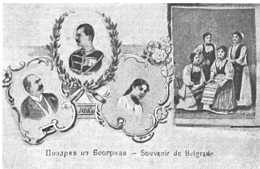
Поздрав из Београда — Souvenir de Belgrade

Сербское открытое письмо съ рисунками въ память бракосочетанія короля Александра съ Драгой Машиною.