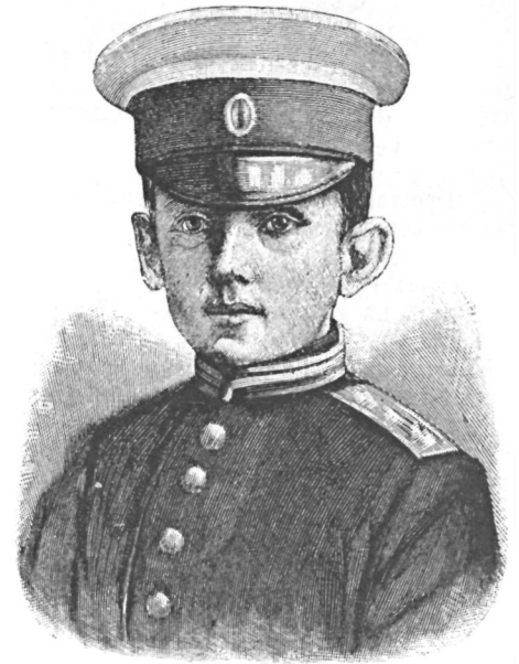
Георгій Петровичъ, наслѣдникъ сервскаго престола.