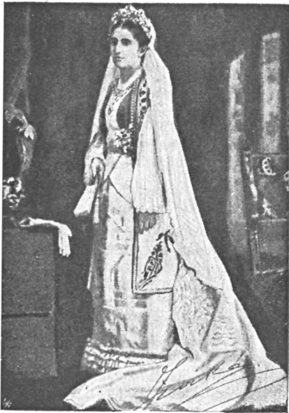
Принцесса Зорка, дочь кн. Черногорскаго, супруга сервскаго короля Петра I. † въ 1891 г.

ный, въ бѣлыхъ, чистыхъ перчаткахъ, которыя, здороваясь и куря папиросу, онъ не снималъ, и искливымъ, рѣзкимъ голосомъ, сильно картавя, заливаясь смѣхомъ, заговорилъ: