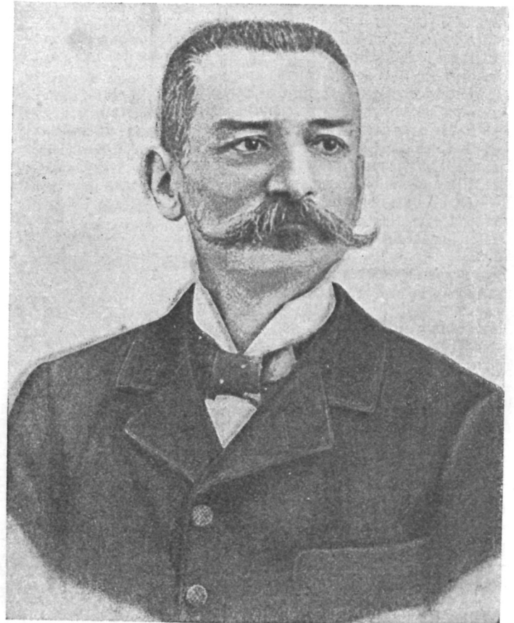
Сервскій король Петръ I. Съ послѣдней фотографіи, сдѣ. анной въ Женевѣ.