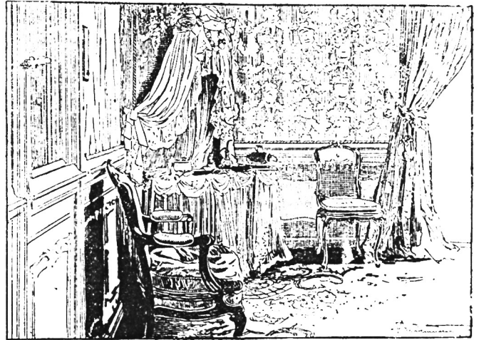
Уборная королевы Драги (налево зеркальная дверь, черезъ которую убѣжала королевская чета).

Когда Бастилія въ 1789 году (великая французская революція) была разрушена, то въ книгѣ регистраціи заключенныхъ“ открыли недостатокъ нѣсколько вырванныхъ страницъ, — онъ то, повидимому, и относился къ „Железной маскѣ“.