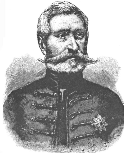
Александръ Карагеоргиевичъ, князь Сербіи съ 1843—1858 гг.

— Очень радъ! — сказалъ Ивашевъ. — Очень пріятно! Москва — прелесть! Это мой какъ будто родной городъ. Ха! ха! ха! — и онъ за-