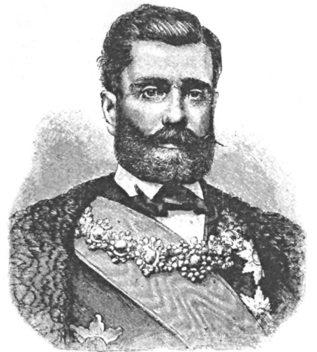
Михаилъ Обреновић, князь Сербии съ 1858—1868 гг.

на этой постели, въ этой самой квартирѣ, скончался герой нашъ, генералъ Рулевъ!