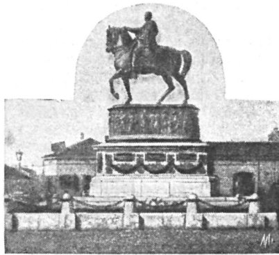
Памятникъ въ Бѣлградѣ князю Михаилу Обреновицу, павшему отъ руки убійцы 29-го мая 1868 г.