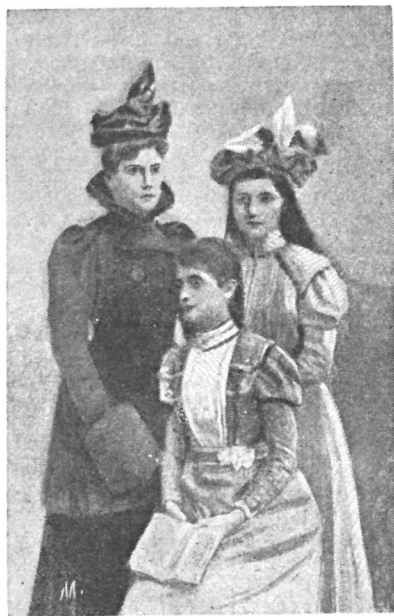
Покойная королева Драга невестой и ея двѣ младшія сестры.

ходящееся въ 15 километрахъ отъ японскаго города Кумамото. Это мѣстечко расположено въ самомъ кратерѣ одного вулкана, повидимому, потухшаго. Тамъ живетъ около 20,000 человекъ. Городокъ этотъ въ высшей степени живописенъ;