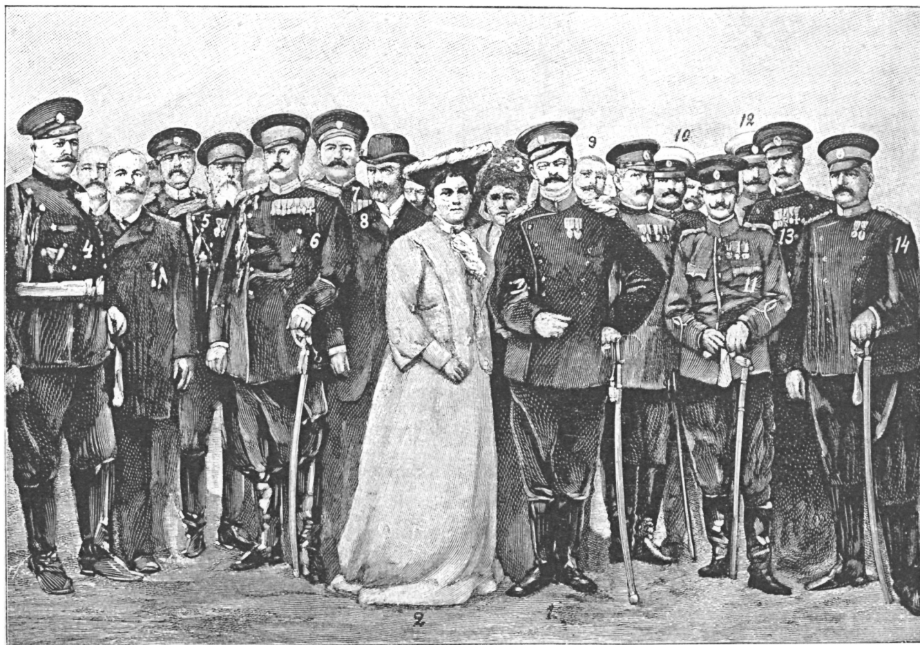
Король Александръ и королева Драга со свитой.

Слѣва—король Александръ и его родители; справа—королева Драга и ея сестры въ національныхъ костюмахъ.