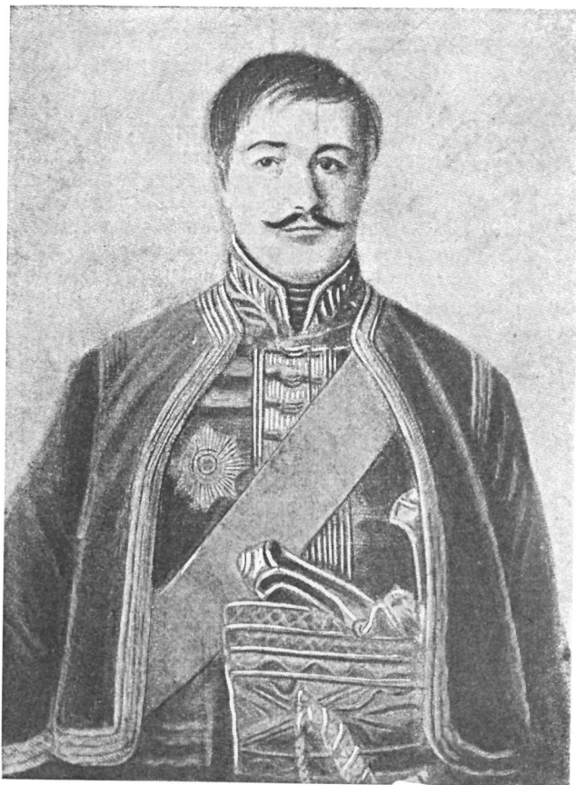
Кара-Георгій Петровичъ, первый князь Сербіи, основатель династіи Карагеоргиевичей, † въ 1817 г.