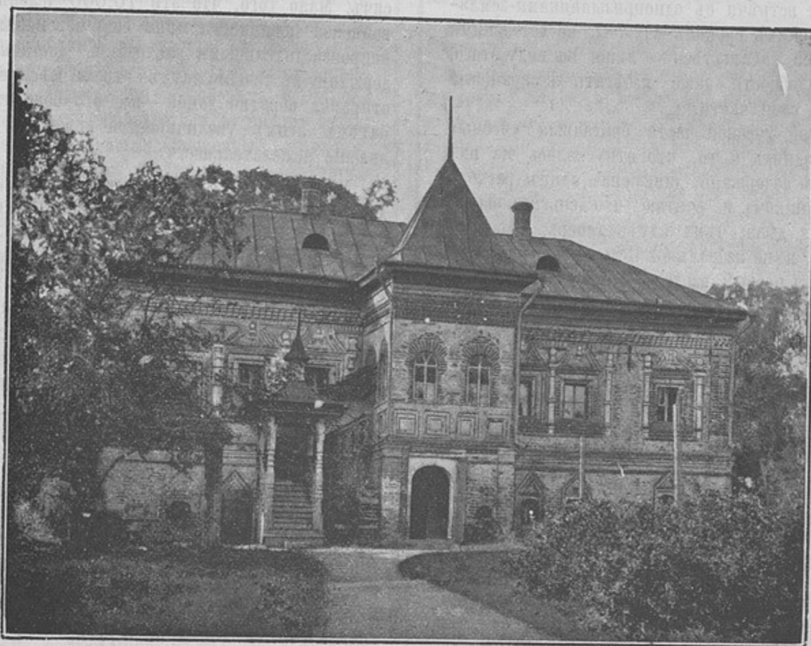
Домъ Марины Мнишекъ въ Калугѣ (къ рецензій «Россія»).

Соотвѣтствующій кадръ унтеръ-офицеровъ пограничной стражи далъ бы учебный унтеръ-офицерскій дивизионъ отдѣльнаго корпуса пограничной стражи , учрежденный по образцу Рижскаго учебнаго унтеръ-офицерскаго баталіона, съ тою же продолжительностью учебнаго курса, съ предоставленіемъ тѣхъ же правъ окончившимъ въ немъ курсъ и съ