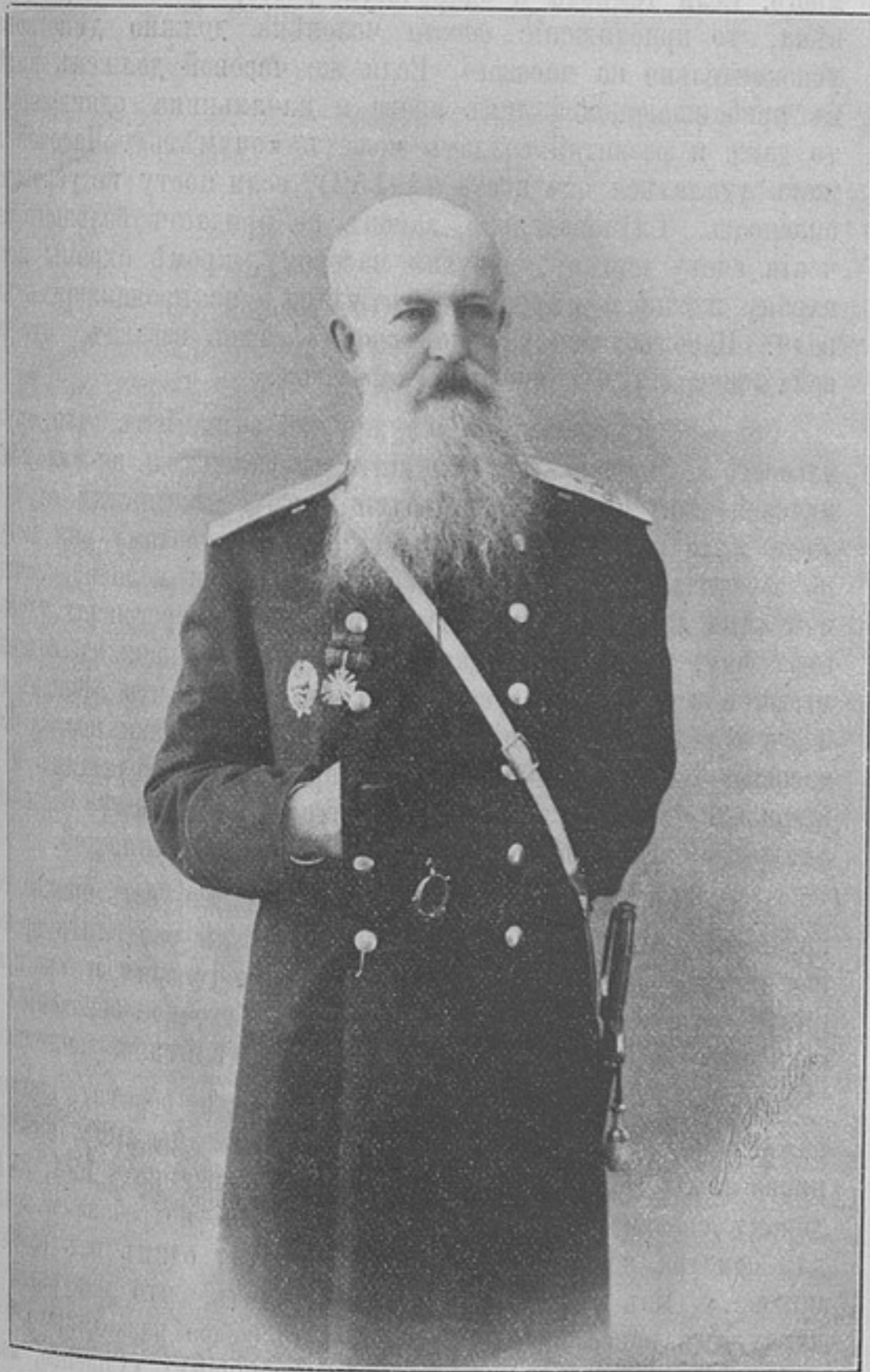
Командиръ 17-го армейскаго корпуса, генераль-лейтенантъ