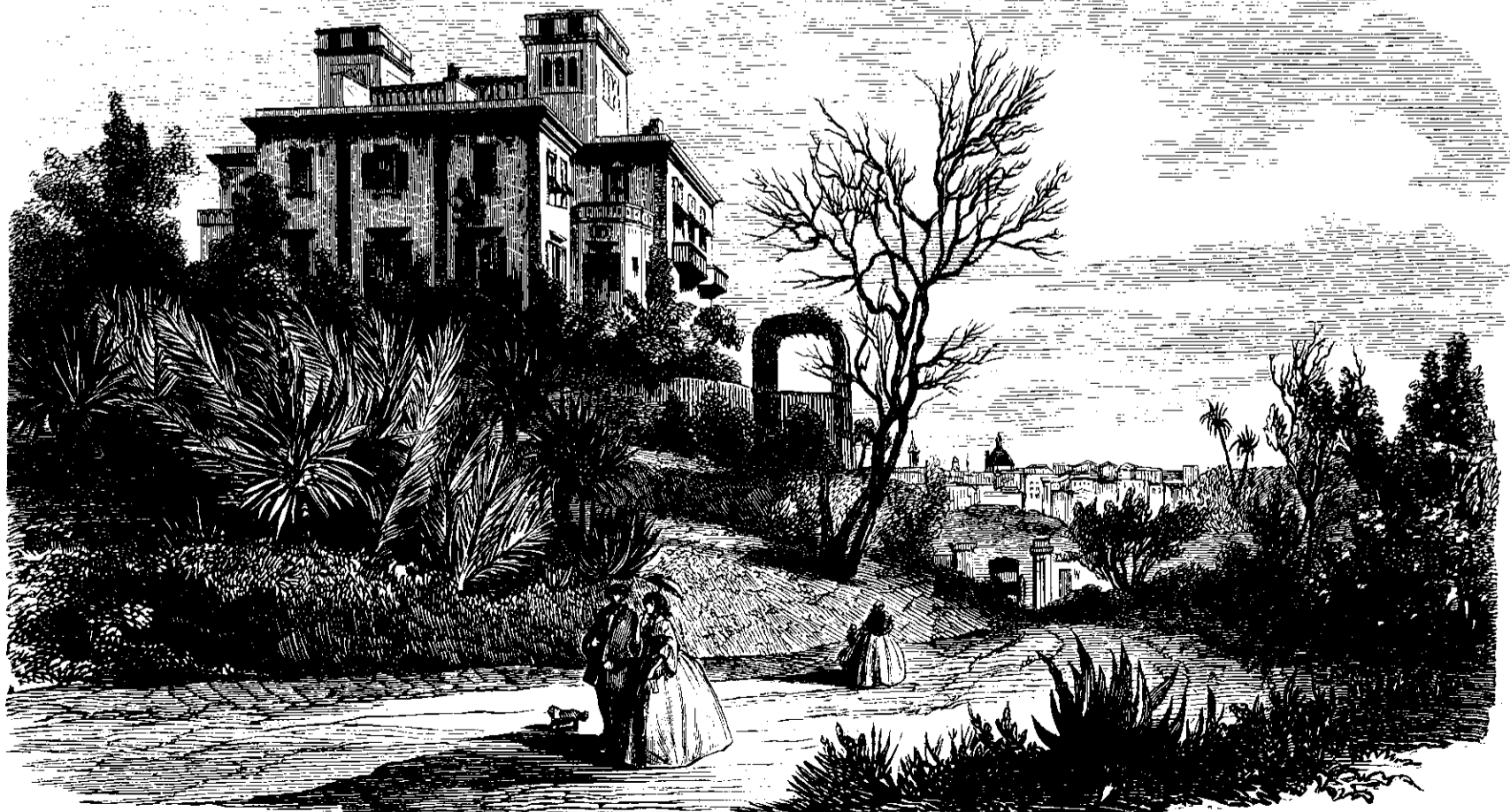
Villa Masfingy ved Nizza.

Bjergstrømmen Paglione deler Byen i to Dele; i den ene Deel, den nye By, danne Husene næsten overalt glatte Fjir-kanter, uden arkitektonisk Prydelse, man ser strax, at de ere bestemte til Kaserer for de Fremmede, og saadanne kunne ogsaa behøves; thi Byen, som paa den varme Aarstid kun huser omtrent en Snees Tusind Menneffer, faaer om Vinteren Udseende af at være en stor Stad. Da fare elegante Kjøretøier gjennem Gaderne, Spadseregangene vrinle af Fremmede fra alle Europas Lande, alle Rum i Hotellerne ere optagne og Modehandlerne gjøre glimrende Forretninger. Paa Torvene og i Gaderne holde smukke Dyrevogne og Muldyr til Afbenyttelse ved Udslugter i Omegnen. Man ser ofte hele