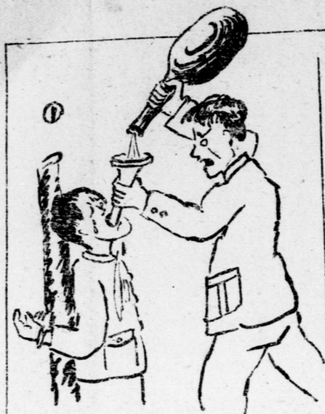
① 補充讀物 向津作 ② 教育生活