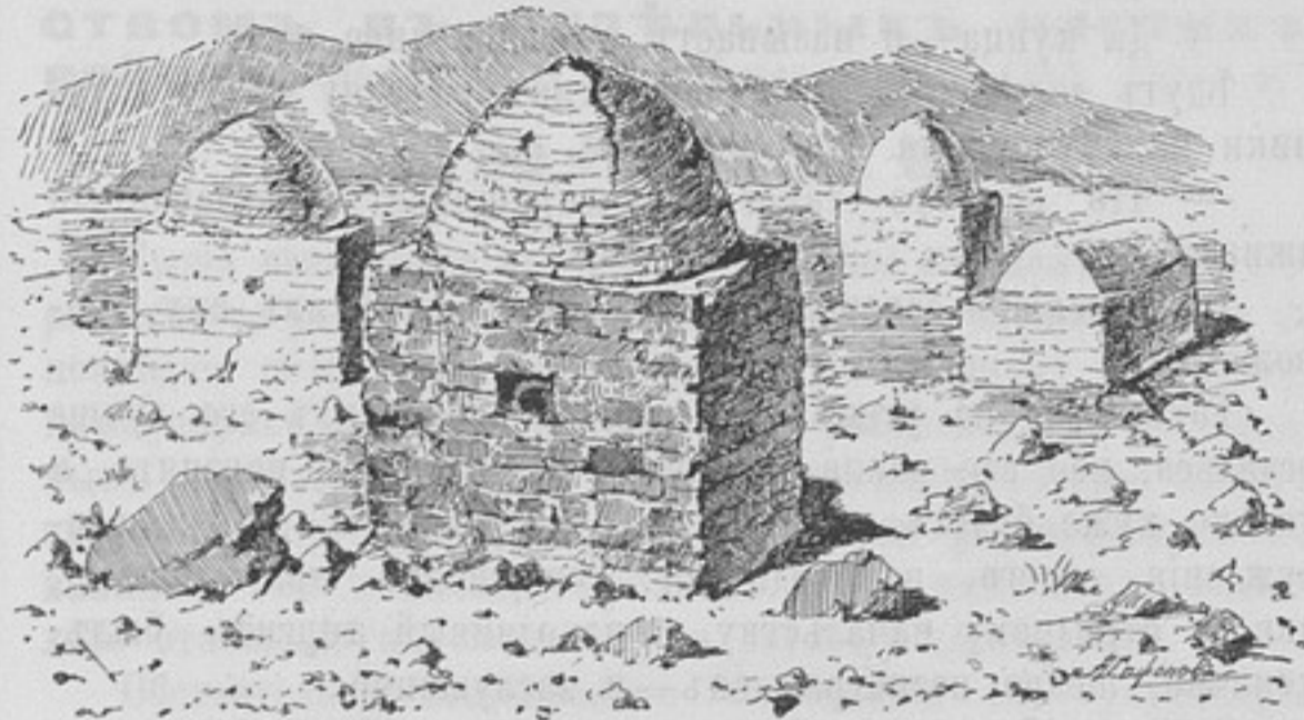
Кладбище Кара-Гуръ, близъ селеній Акъ-байтала и Акъ-су съ Мургабомъ.

Выступили мы седьмого, въ составѣ нашей роты, саперной команды, сотни казаковъ и взвода конно-горной батареи и подошли къ переправѣ, гдѣ и расположились бивакомъ. Весь слѣдующій день былъ употребленъ на тяжелую переправу черезъ рѣку; переправлялись на лошадяхъ, верблюдахъ