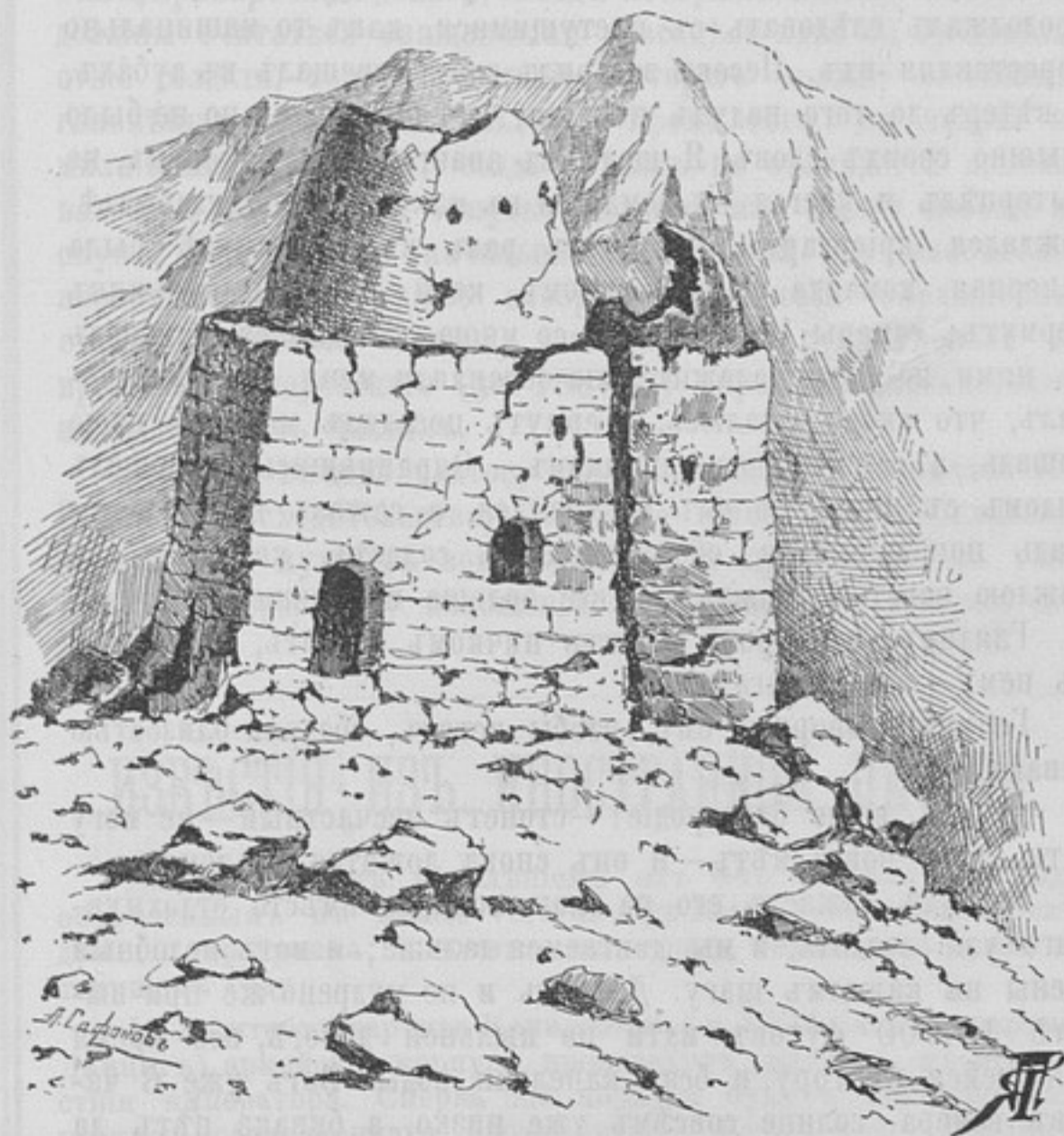
Могила на оз. Яшиль-нуль недалеко отъ столкновенія съ афганскимъ постомъ.