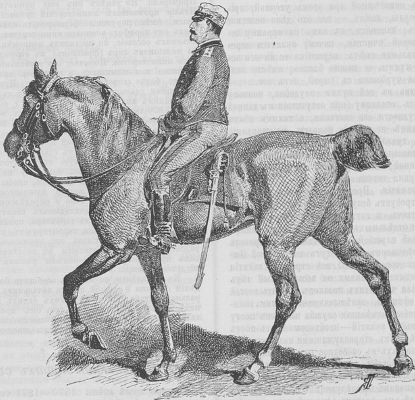
Начальникъ генеральнаго штаба, генераль-лейтенантъ Доменико Примерано.

(Къ ст. «Новый нач. ген. шт. въ Италіи».)