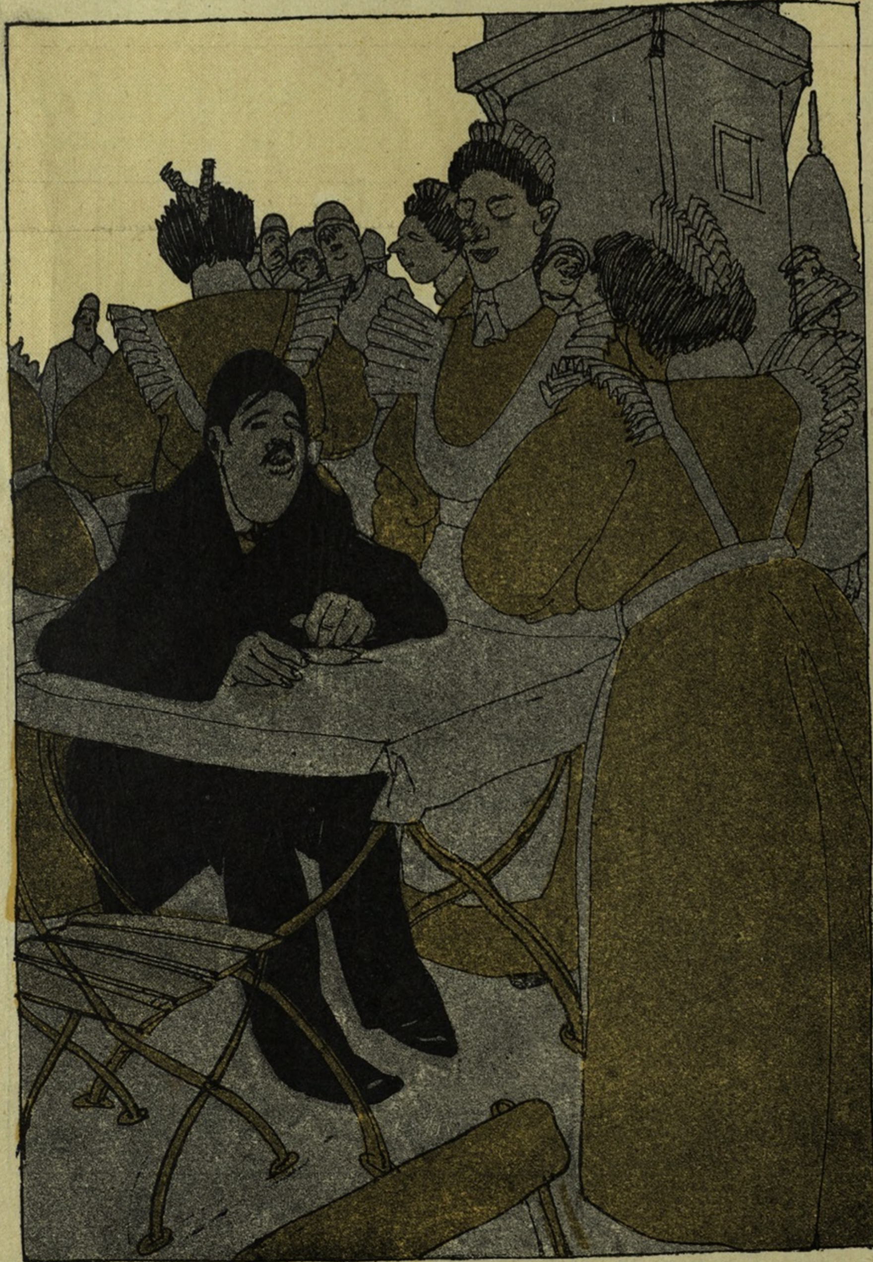
Рис. А. Яковлева.