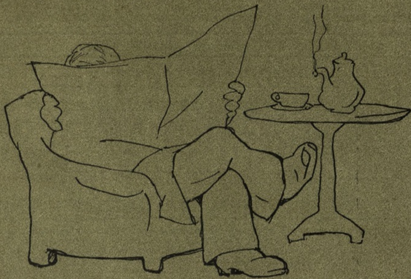
Рис. А. Юнтера.

Мяткинъ читалъ газету: — Ого! Этого нельзя, этого нельзя, это воспрещается... Что же можно?