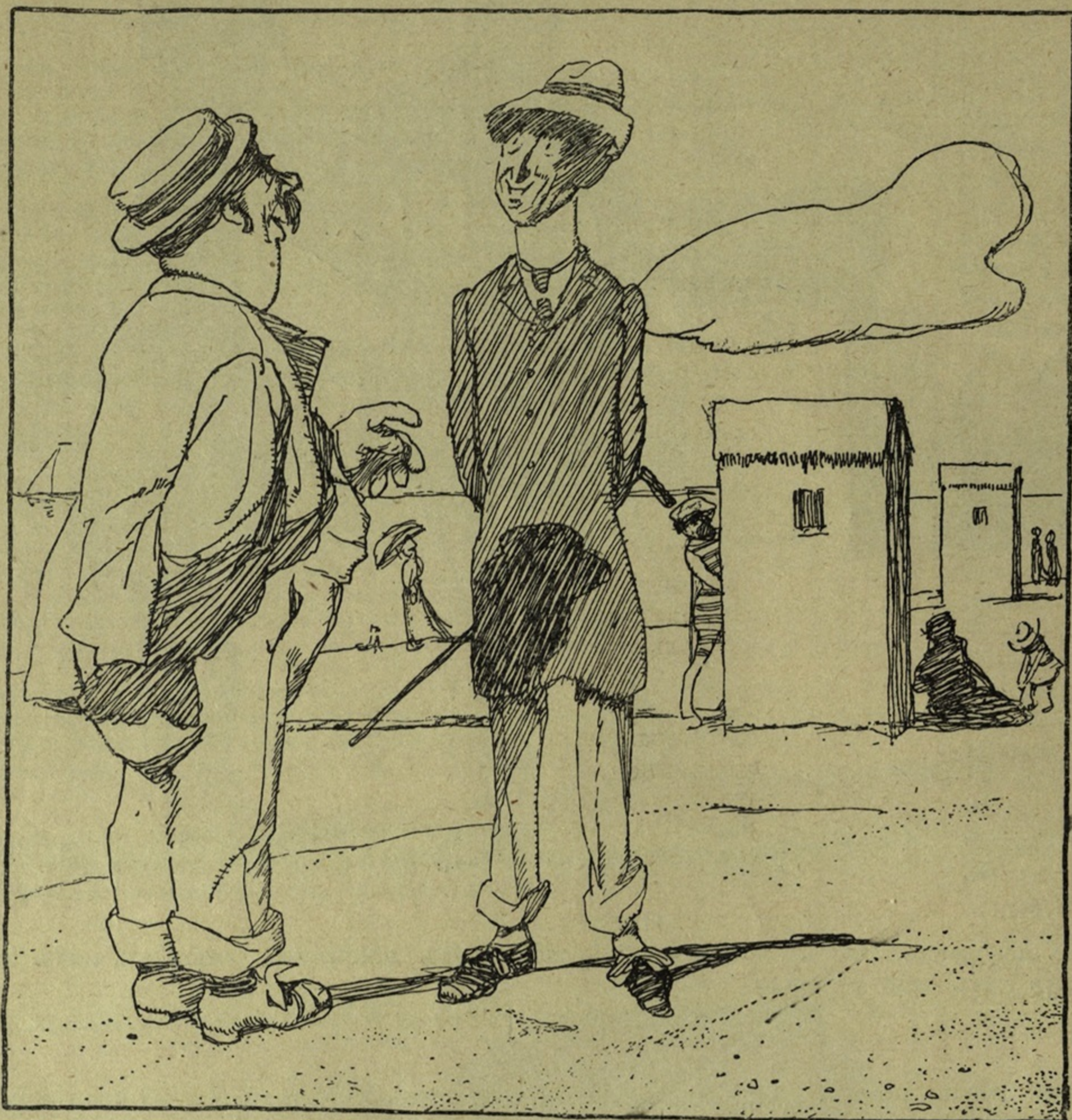
Рис. А. Радакова.