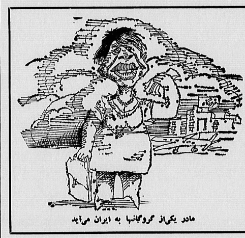
مادر یگاز گروگانها به ایران می‌آید