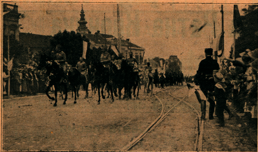
Славље у Београду: Престолонаследник Александар са својим штабом на челу победоносне српске војске

Скопља, Прилипа, Битоља, Брегалнице и др. О тој прослави донели сте ви у вашем листу подробен извештај; мени остаје да речем коју о уписцима , које је народ понео са те прославе и да изнесем написе и записе, који прослави даше обележје, и још неке друге ствари од значаја. Ево их.