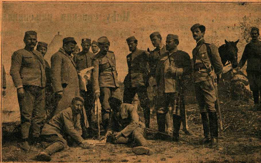
Црногорски официри на бојном пољу

Поред врућег оружја чини неспособнима за даљу борбу, и данас још, хладно оружје . Хладног оружја има две врсте: тупог и оштрог. У тупо спадају кундаци, камење и други чврсти предмети, којима се војници у борби неких пута служе. У оштро хладно оружје спада сабља, ханџар, нож и бајонет. Пред руско-јапански рат је свет држао, да ће покрај садашњег усавршеног врелог оружја бити само борби из далека, а борбе из близа, на бајонет биће ретке или их скоро и неће бити. Ну јапанско-руски рат је доказао, да су борбе на бајонет и у модерном рату потребне и доста честе. Рат између балканских савезни-