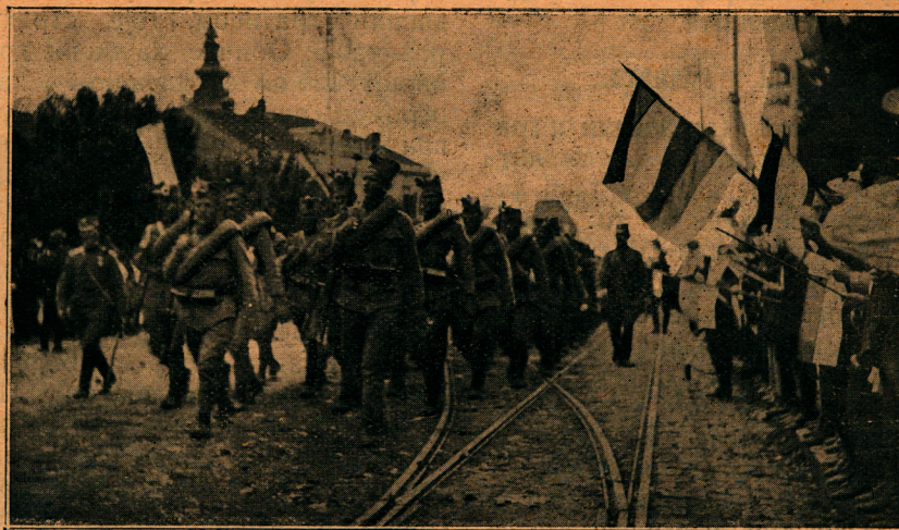
Славље у Београду: Победоносна српска војска пролази улицама београдским

Споменик је израдио Србин вајар. На полеђини споменика тумачи се на каменитој, мраморној плочи златним словима читава ова композиција на споменику. Небројени венци ките споменик, уз топове и митраљеви заробљене од непријатеља, још