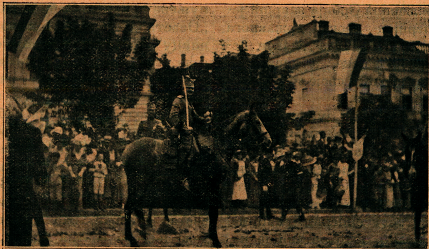
Славље у Београду:

Тужне осећаје изазиваше у гледалаца пољска болница, која је уређена у излогу у „Москви“. Болесници — рањеници од воска вешто израђени леже на слами, крај њих лекар забринут и сетан а хитра женска у белини — болничарка представљају доста неравно право стање у такој једној болници у логору.