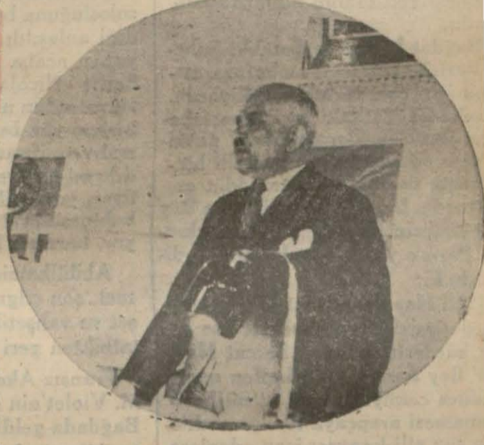
Recep B. konferans verirken

"Mütarekenin askeri tatbikatı bitmişti. Memleketin demiryolları, mühim sevkülceyiş noktaları, Kilikya, Antalya havalisi, Samsun, Zonguldak kuvvetli düşman kolları tarafından istilâ edilmişti. Türkiye kolları bağlı bir arslan vaziyetinde idi. Bu vaziyette Türkiyenin can alıcı noktasına dokunuldu, İzmir birinci Yunan fırkası işgal etti. Mütarekenin ilk ayı zarfında İskenderon iş-