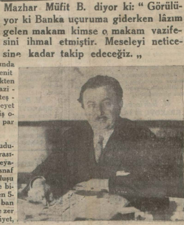
Dahiliye Vekili Şükrü Kaya Bey

Gene raporda bankanın alacaklıları ne kadar kuvvetli ise bankaya borçlu olanların borçlarını ödemek hususunda o kadar kayıtsız ve zavıf oldukları ve bunlardan bazıların borçları olan on binlerce liradan on lirasına veremeyecek halde buldukları ve bankanın bida-yetinden beri mevzuunun haricinde