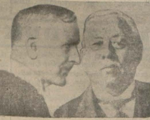
Amerika Hariciye nazırı M. Hul ve Amerikadaki Japon sefiri Amiral Saito

"Japonya'nın Sir Con Saymon'un istizahını mucip olan gayri resmi beyannamesini izah ettikten sonra, M. Hirota, hükümetinin dokuz devlet muahedesine veya sair muahedelere kat'iyen tecavüz niyetinde olmadığını ve Çin'de açık kapı ve müsavatı hukuk siyasetini her devletten ziyade müsait bir (Devamı 7 inci sahifede)